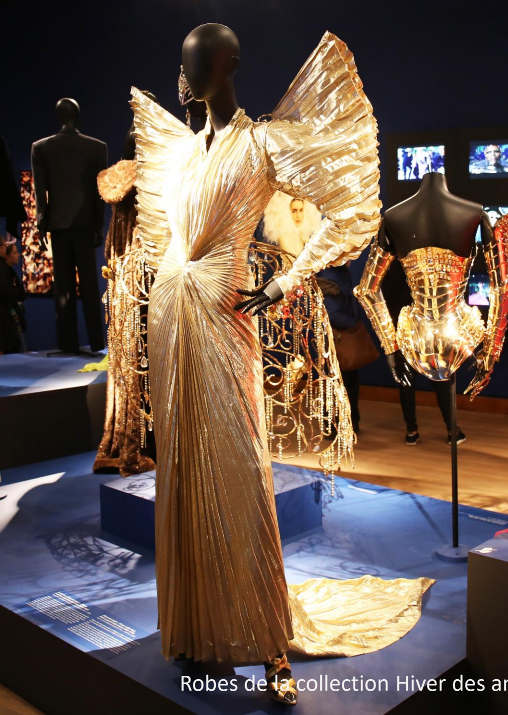
Robes de la collection Hiver des anges