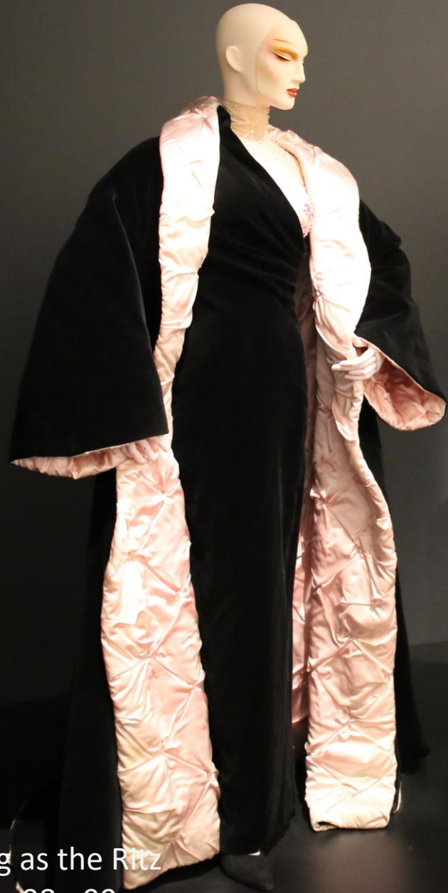
Collections As big as the Ritz Haute couture 98 - 99