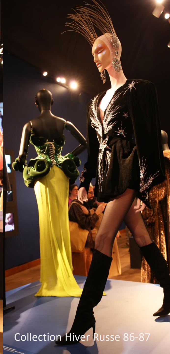
Collection Hiver Russe 86-87