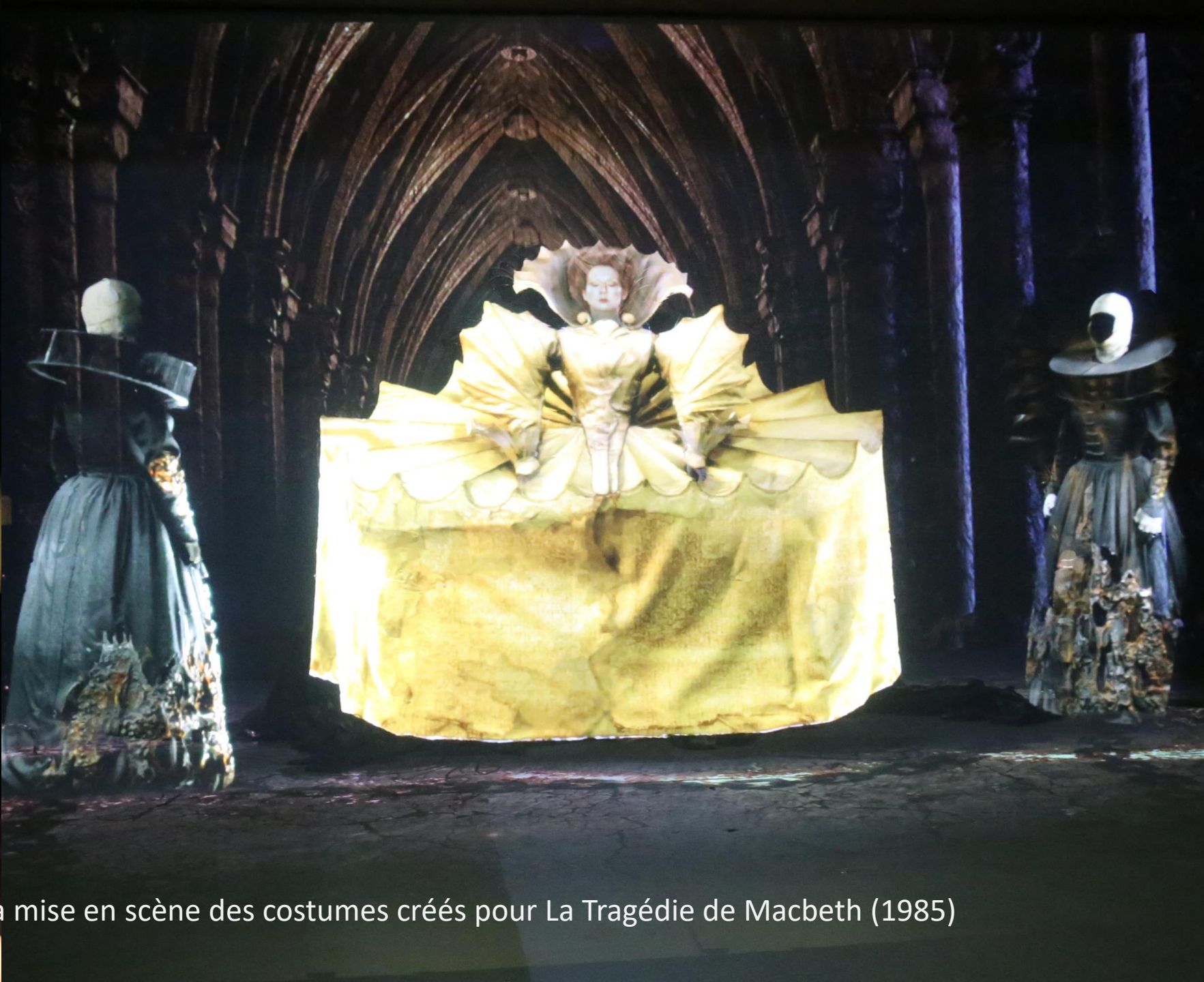
L'exposition débutait par la mise en scène des costumes créés pour La Tragédie de Macbeth (1985)