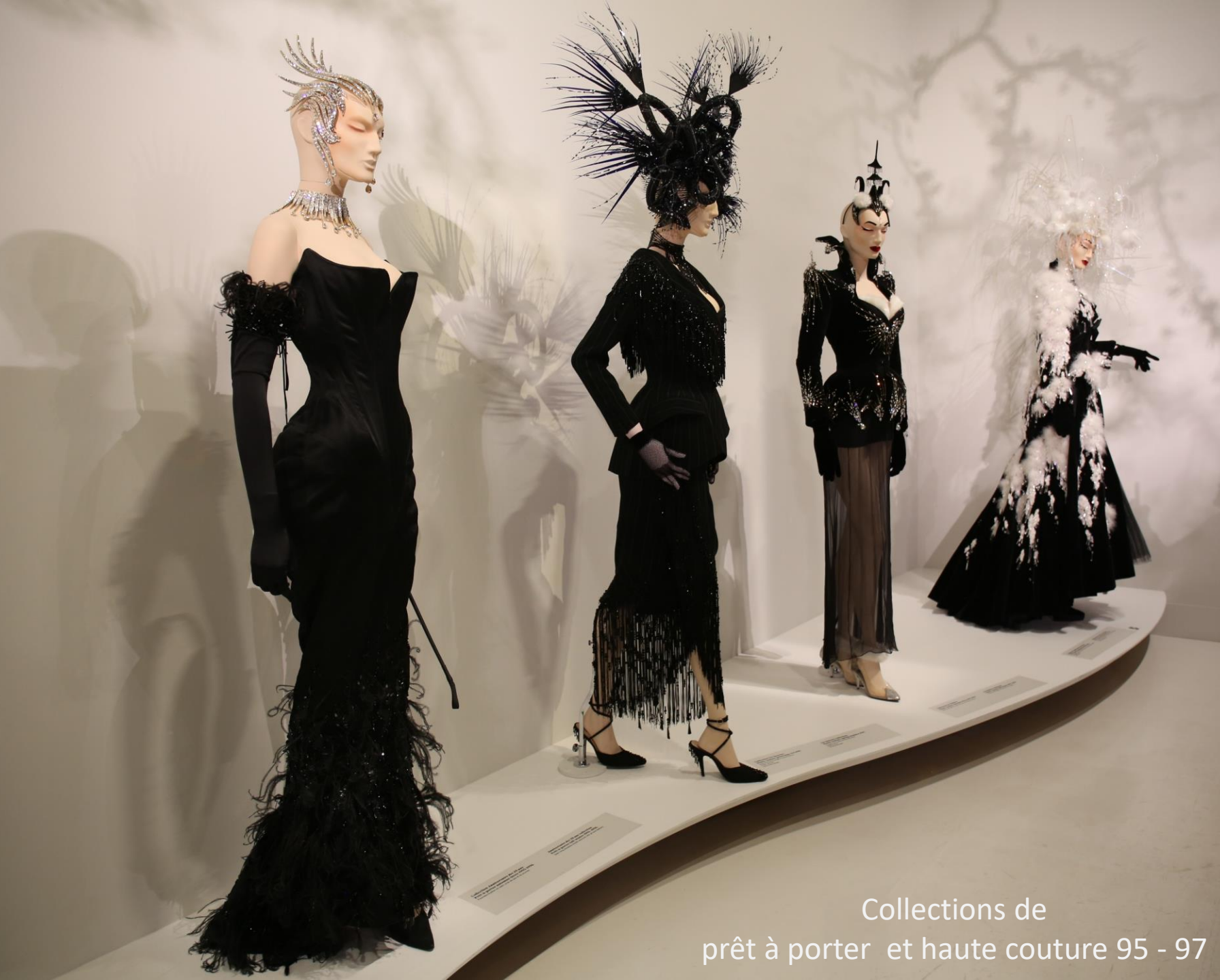
Collections de prêt à porter et haute couture 95 - 97