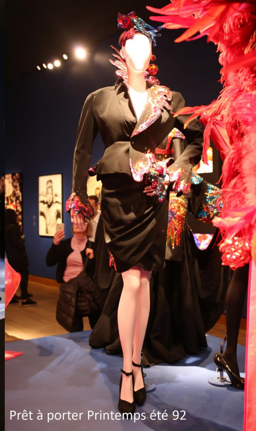
Prêt à porter Printemps été 92