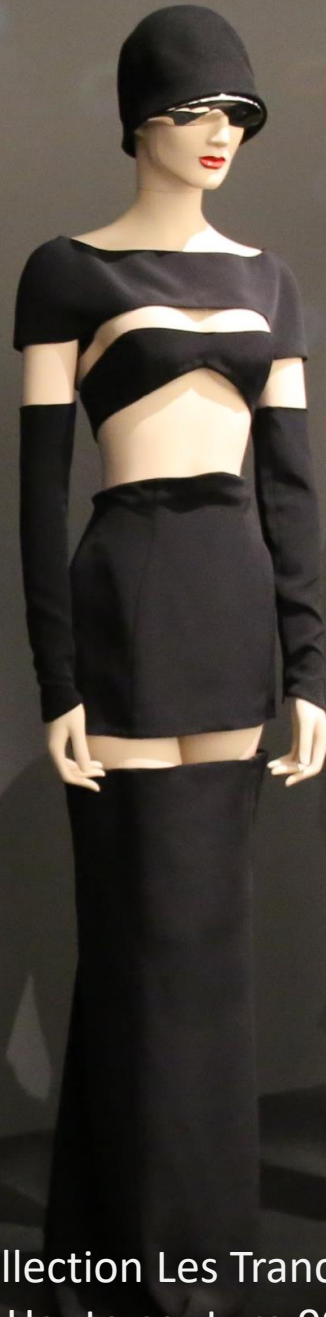
Collection Les Tranchés Haute couture 99