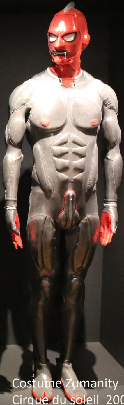
Costume Zumanity Cirque du soleil 2003