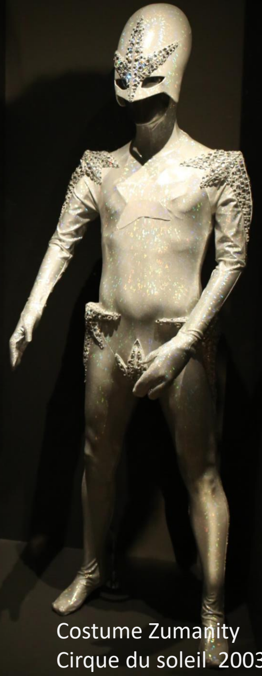
Costume Zumanity Cirque du soleil 2003