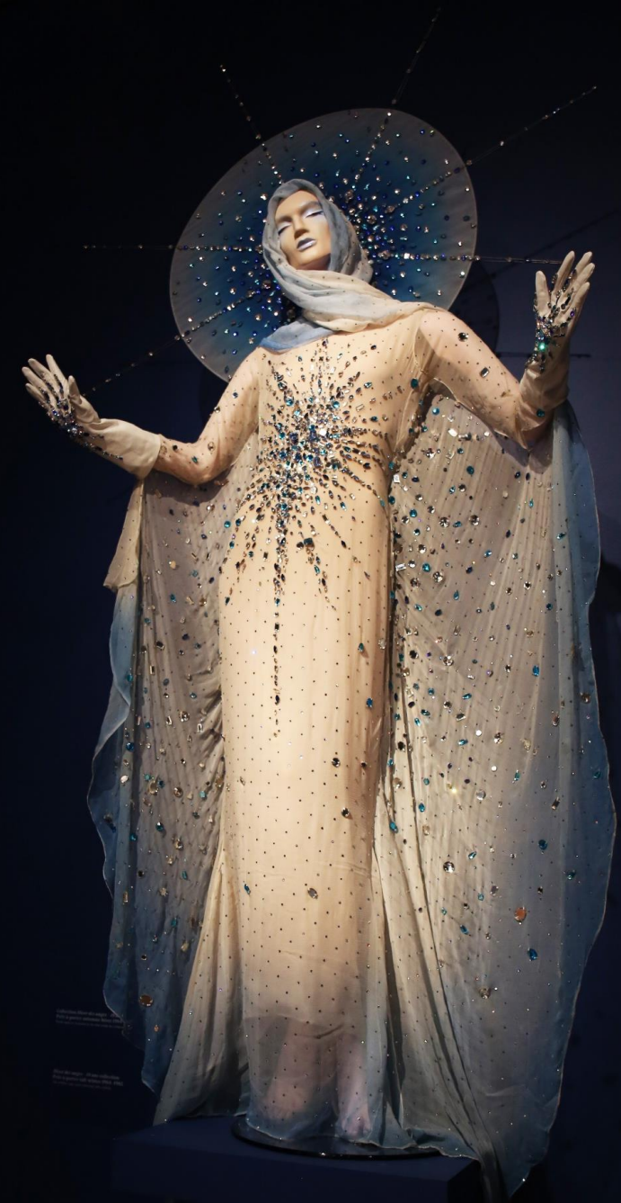
Collection Hiver des anges