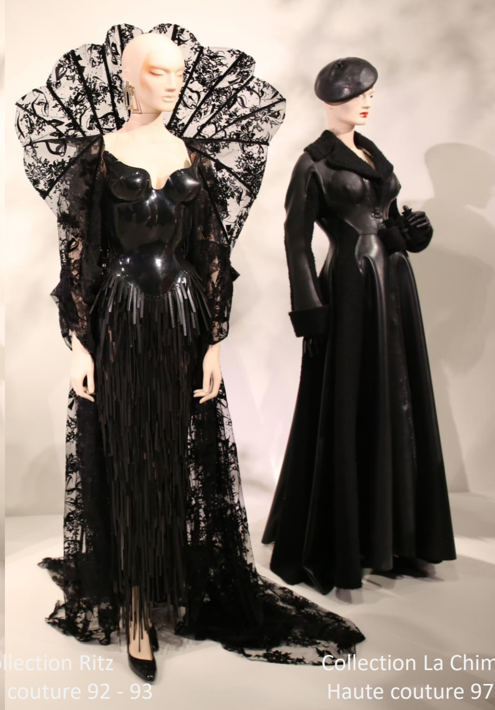
Collection La Chimère Haute couture 97-98