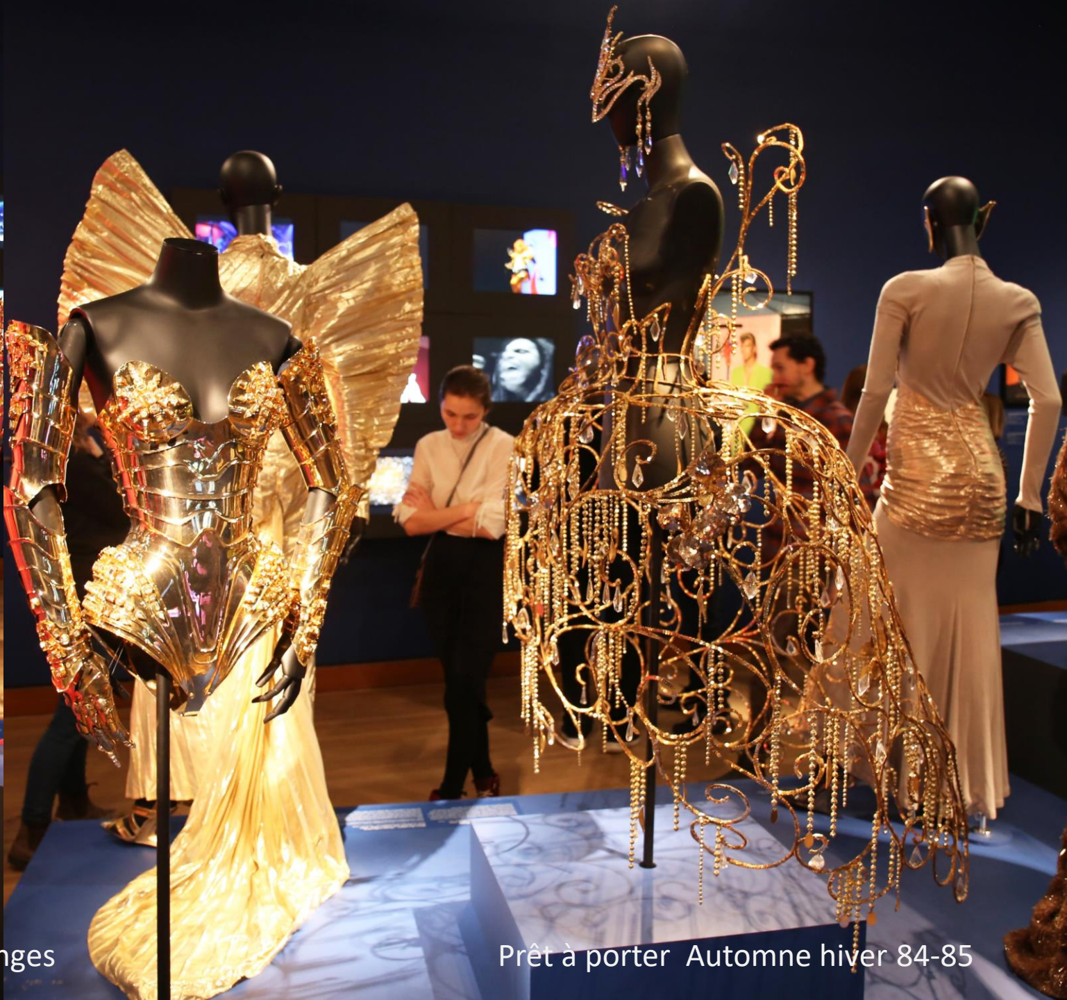
Prêt à porter Automne hiver 84-85