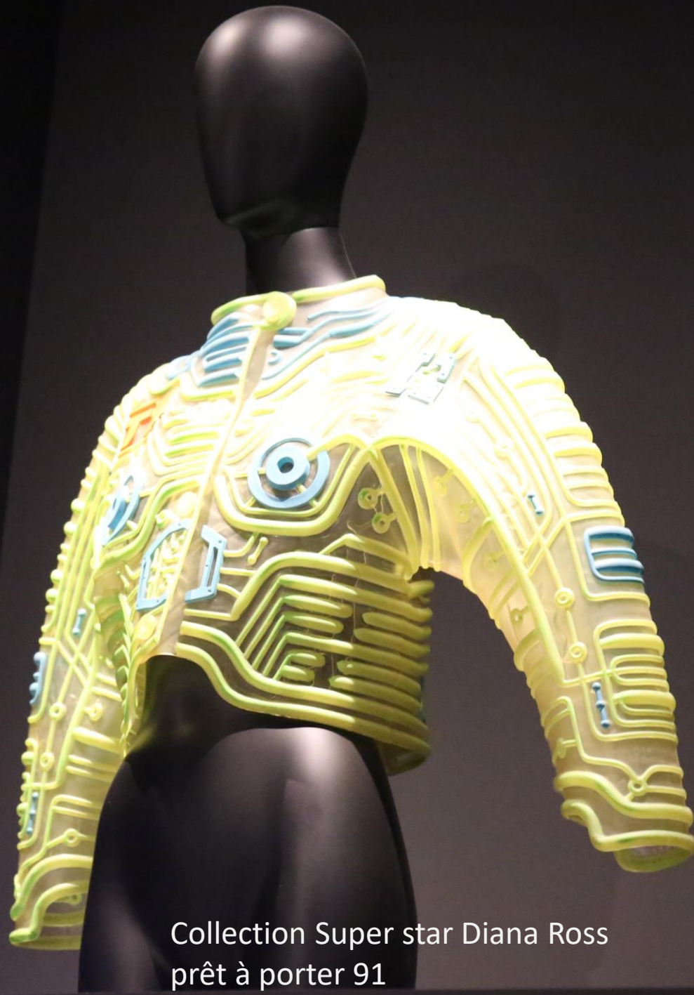
Collection Super star Diana Ross prêt à porter 91