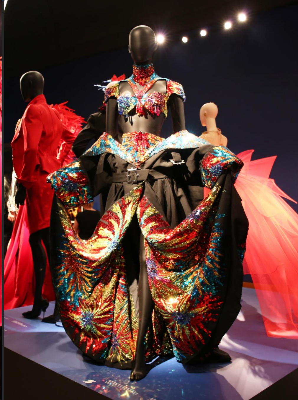
L'exposition enchaîne ensuite sur les collections automne hiver 95 - 96