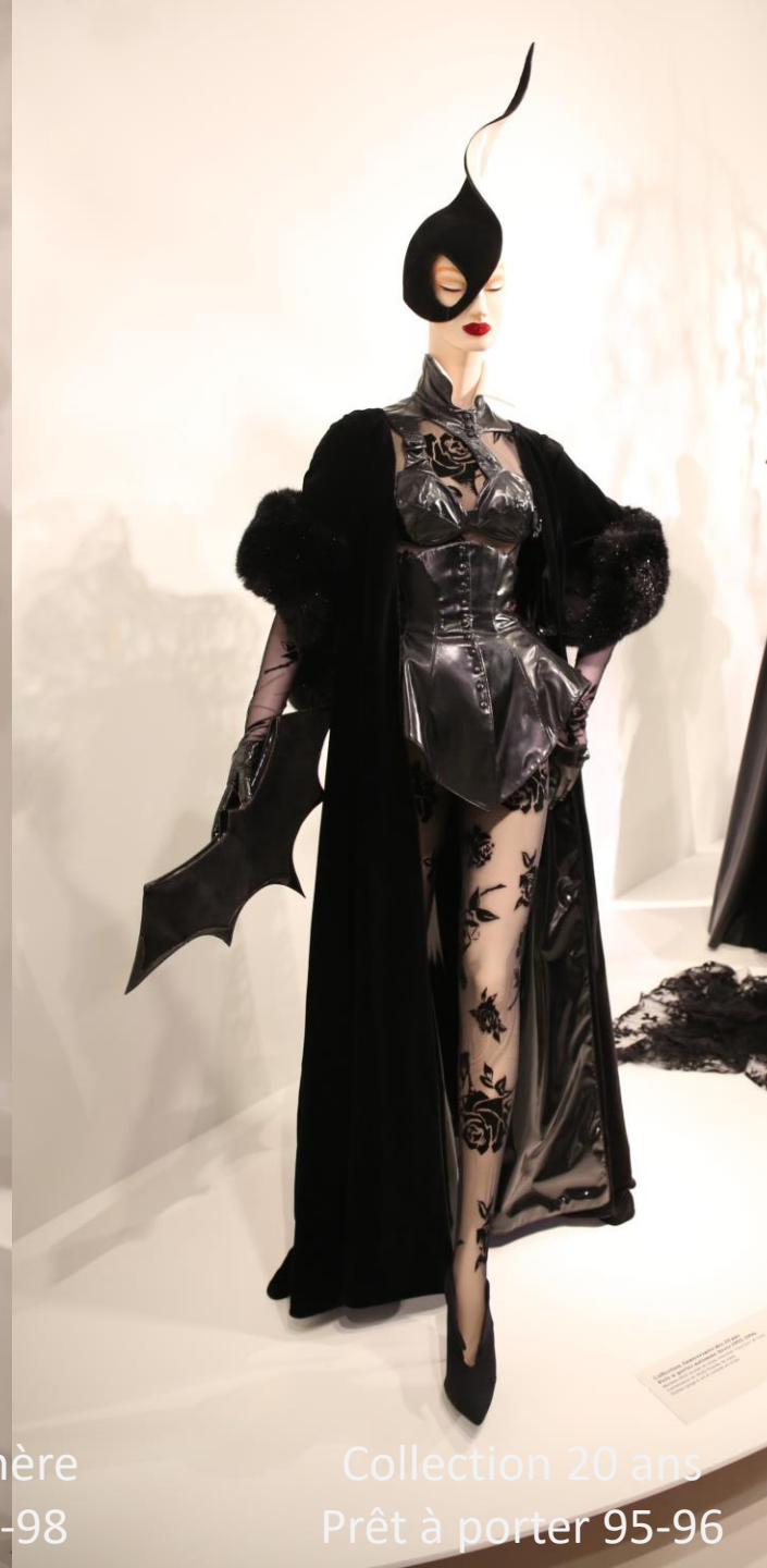
Collection 20 ans Prêt à porter 95-96