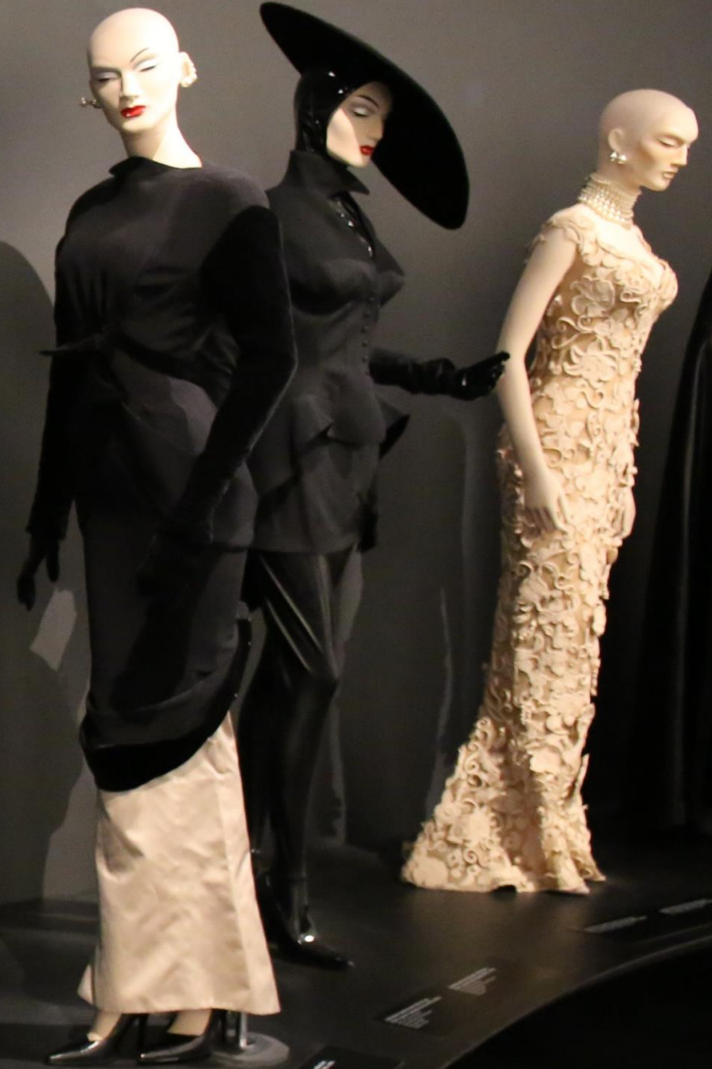
Collection 20 ans Prêt à porter 95-96