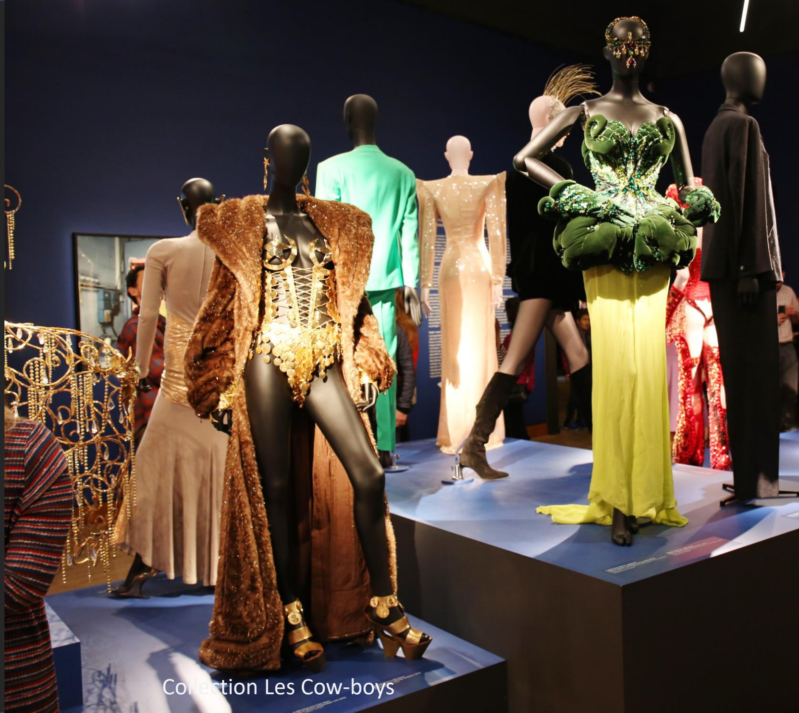
Collection Les Cow-boys