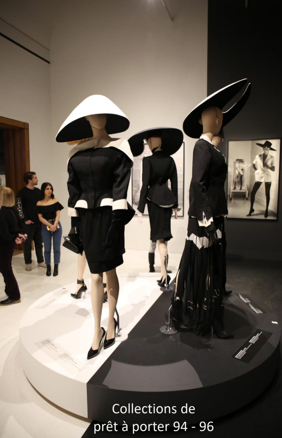
Collections de prêt à porter 94 - 96