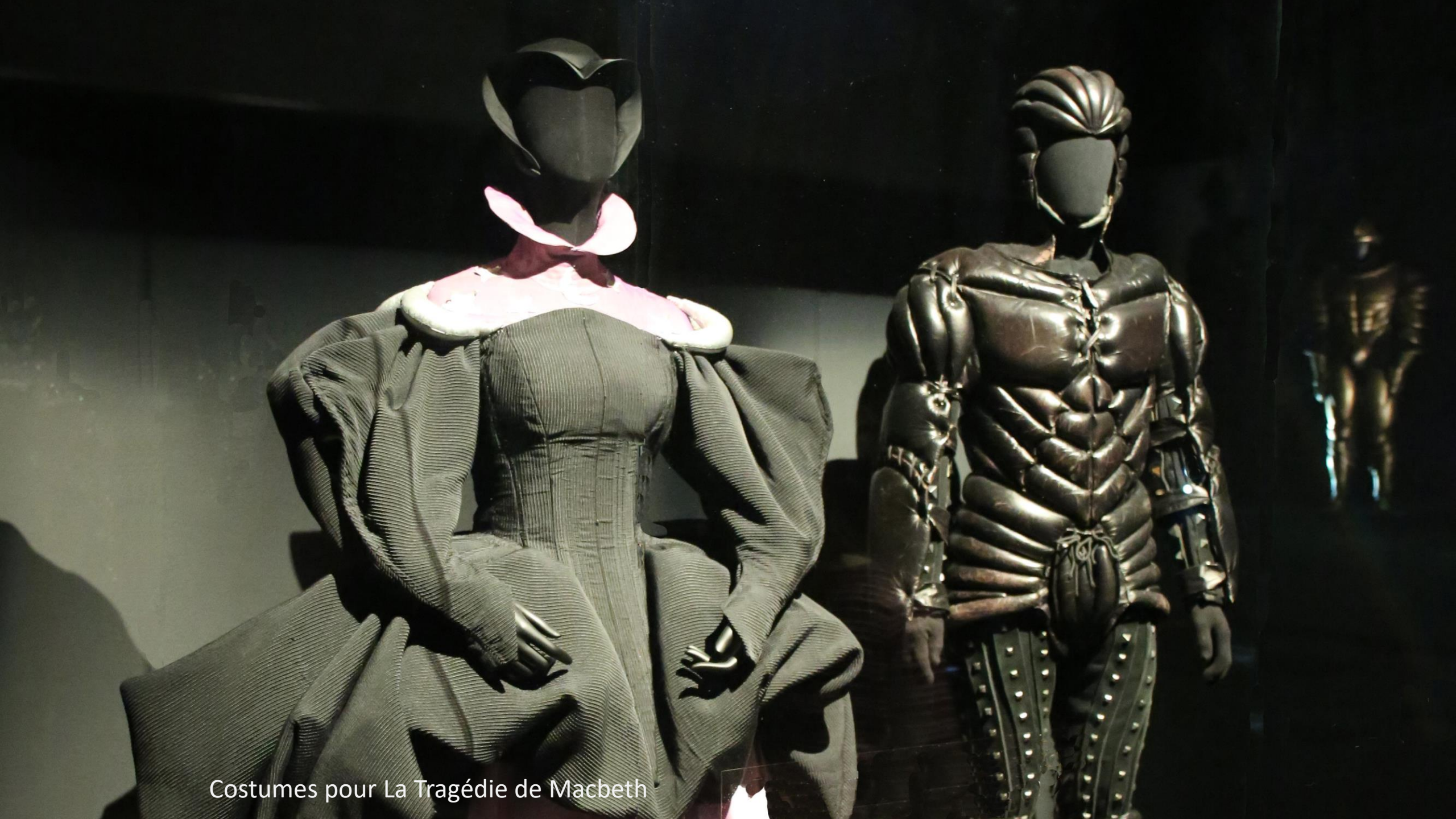
Costumes pour La Tragédie de Macbeth