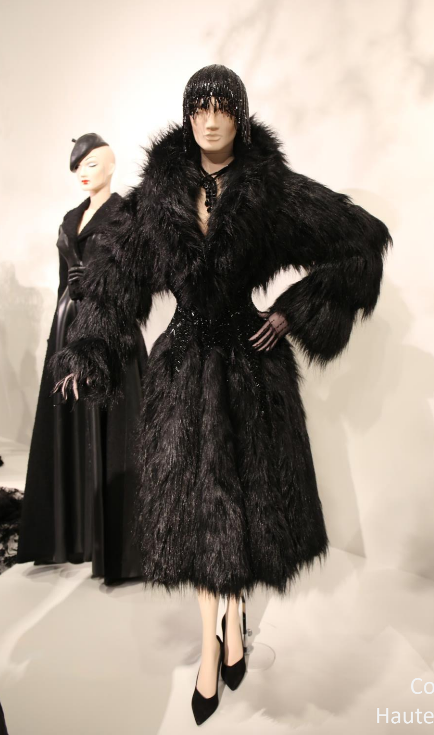
Collection Ritz Haute couture 92 - 93