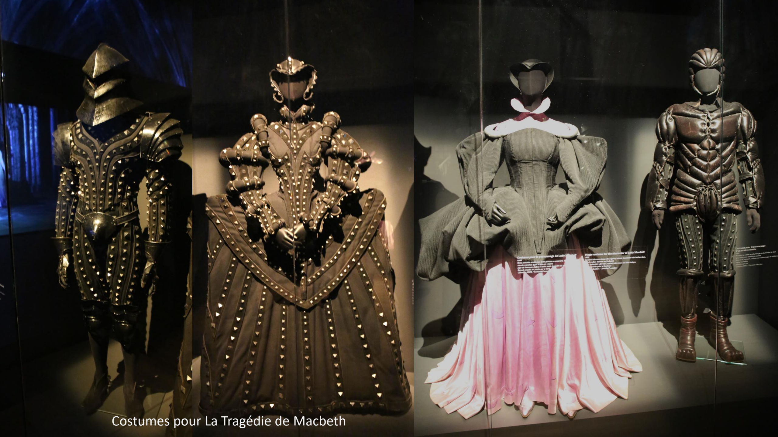
Costumes pour La Tragédie de Macbeth

Costumes pour le personnage de Lady Macbeth 1999 Belle assemblée de vêtements dans un esprit de... on peut remarquer plus de 1000 rivets... plus de 1000 rivets à l'intérieur de la jupe... plus de 1000 rivets sur la jupe... Collection CMO / Conception Stage costume for the character of Lady Macbeth 1999 Belle assemblée de vêtements dans un esprit de... on peut remarquer plus de 1000 rivets... plus de 1000 rivets à l'intérieur de la jupe... plus de 1000 rivets sur la jupe... Collection CMO / Conception