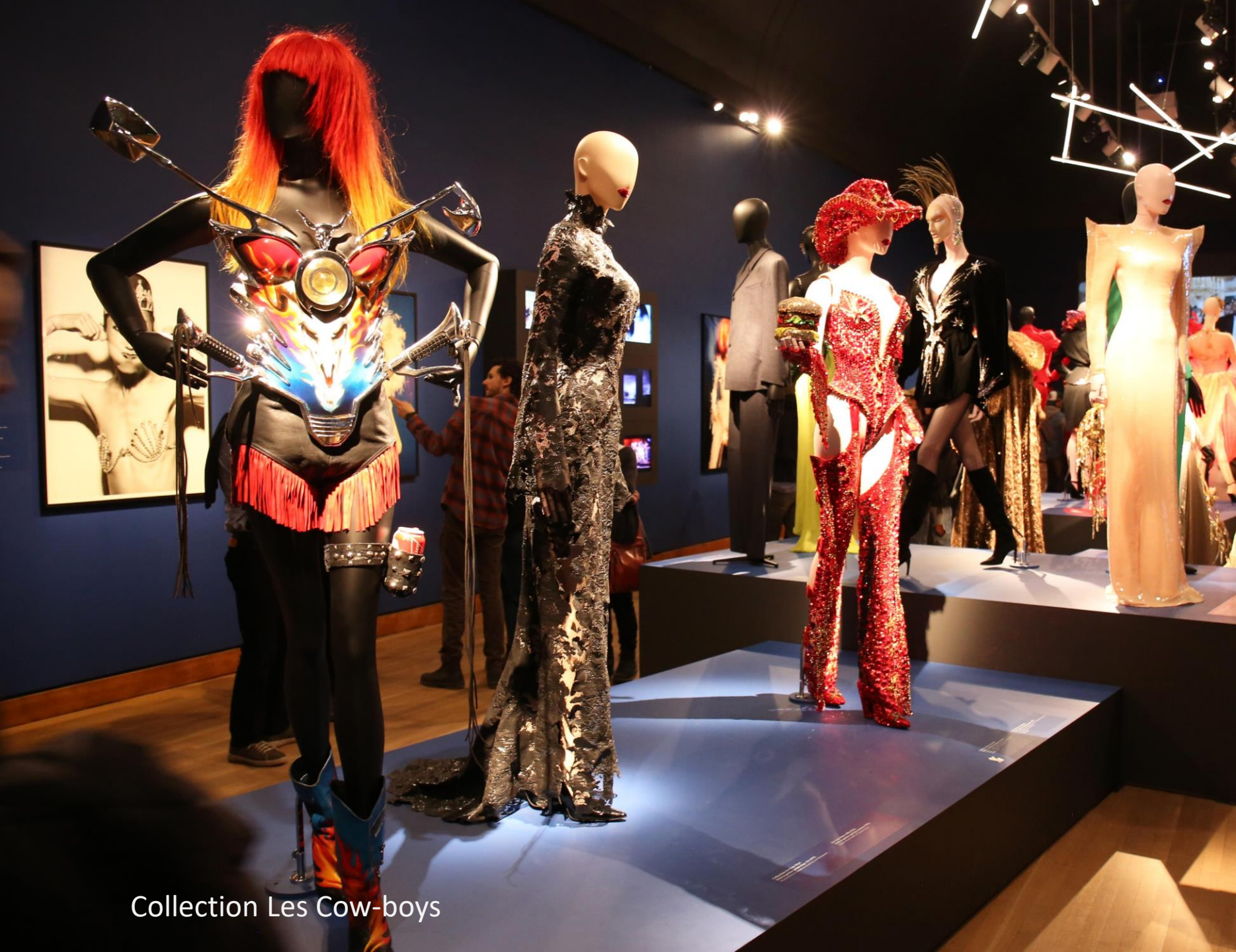
Collection Les Cow-boys