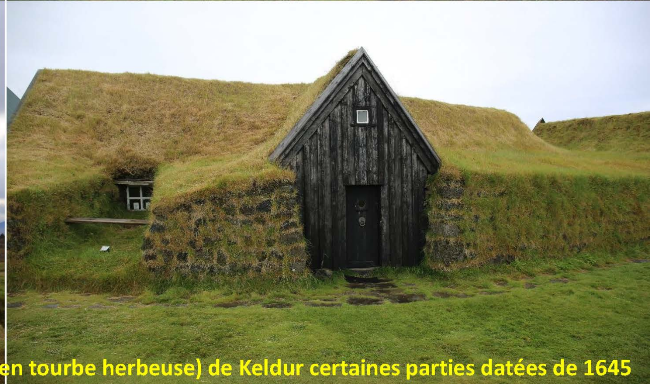
Les thorfus (maisons en tourbe herbeuse) de Keldur certaines parties datées de 1645