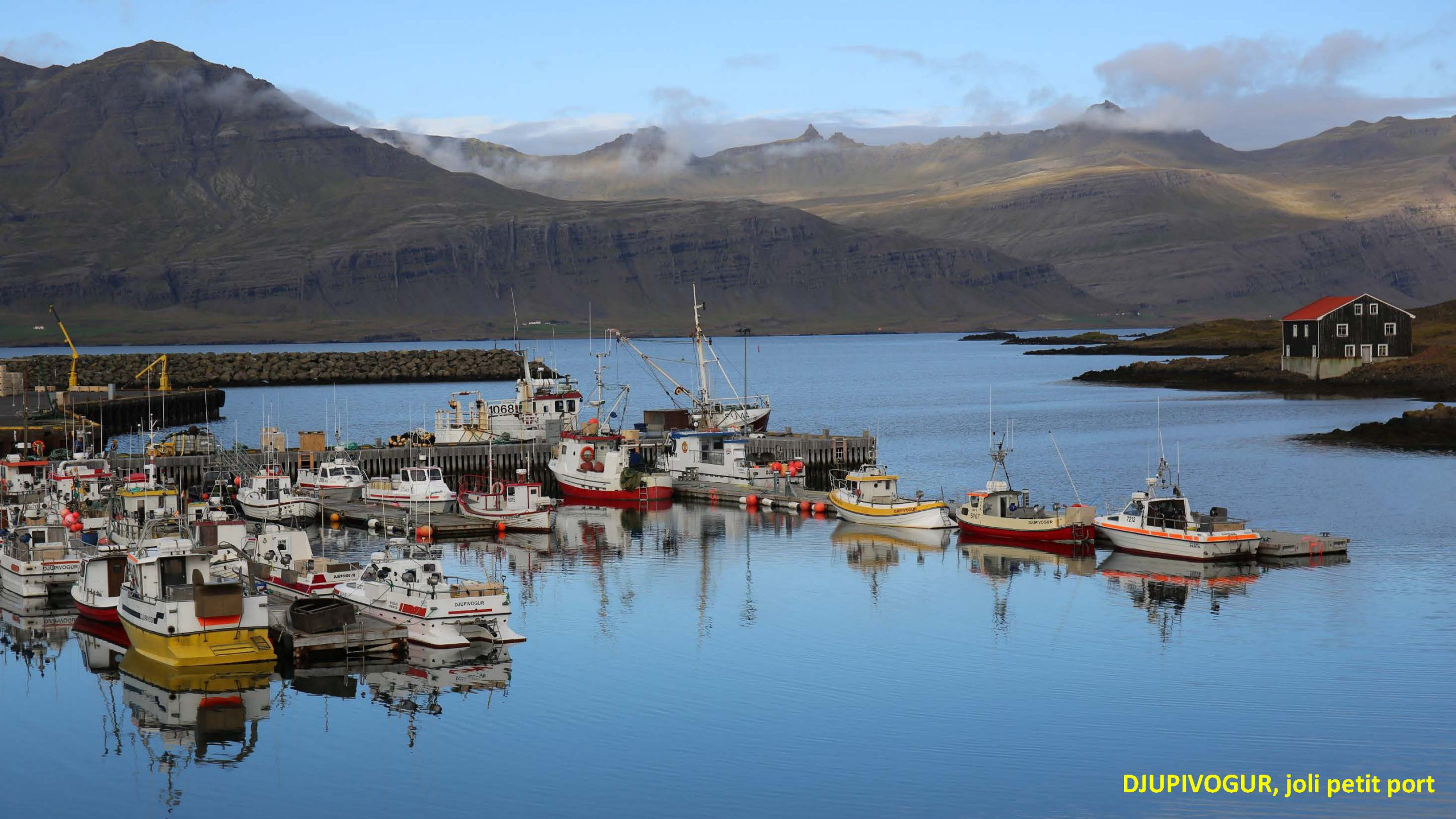
DJUPIVOGUR, joli petit port