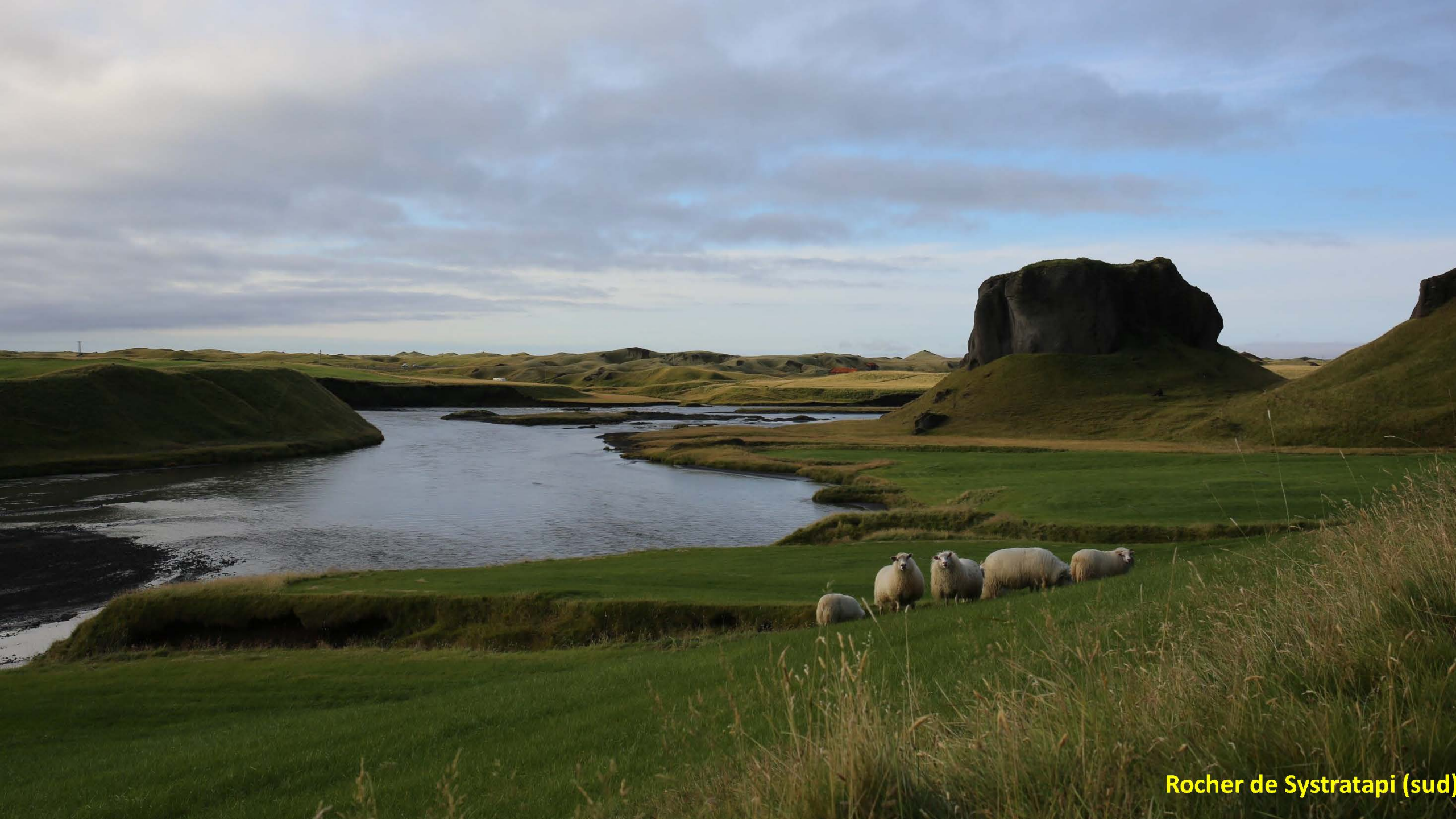
Rocher de Systratapi (sud)