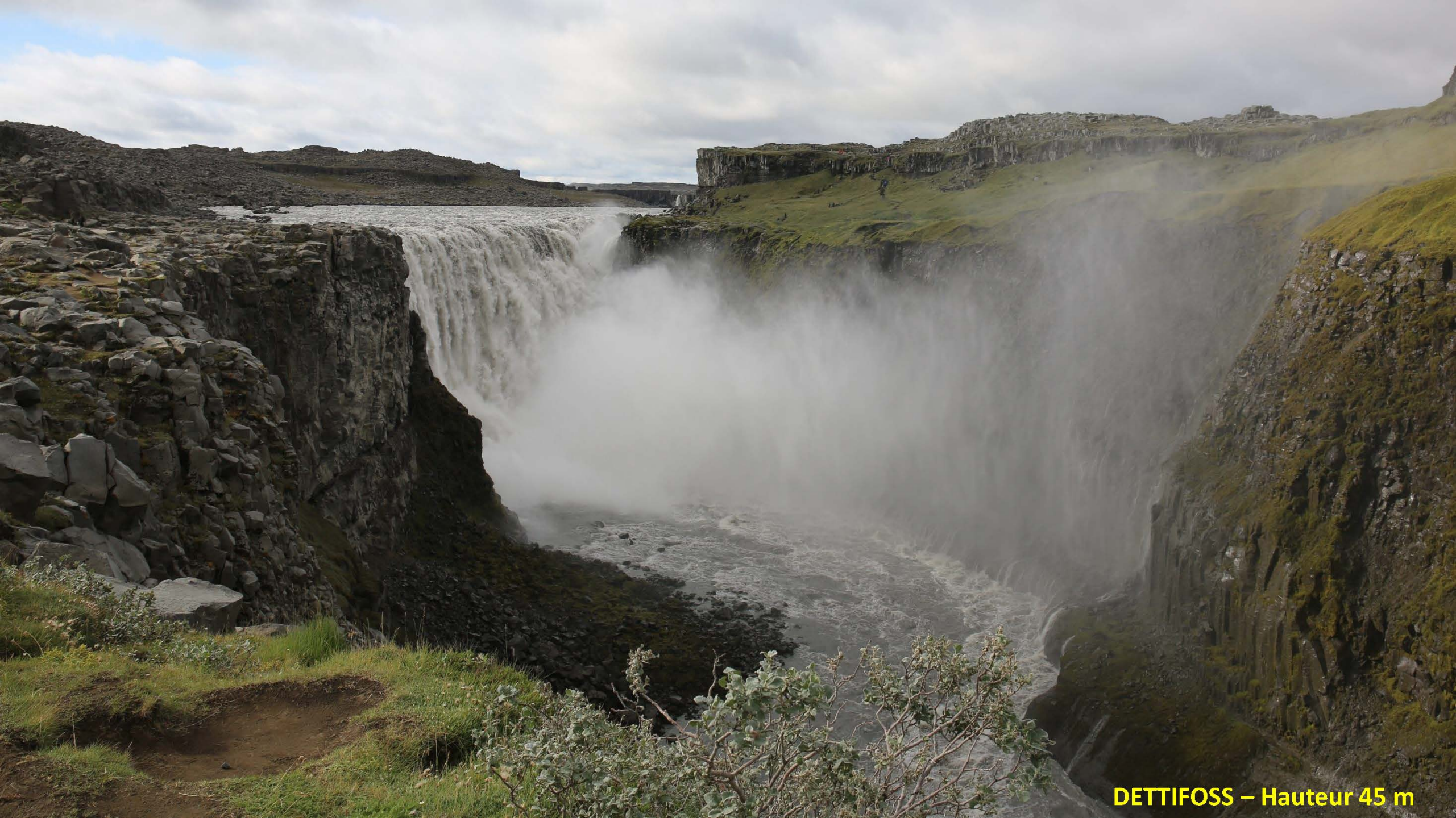
DETTIFOSS – Hauteur 45 m