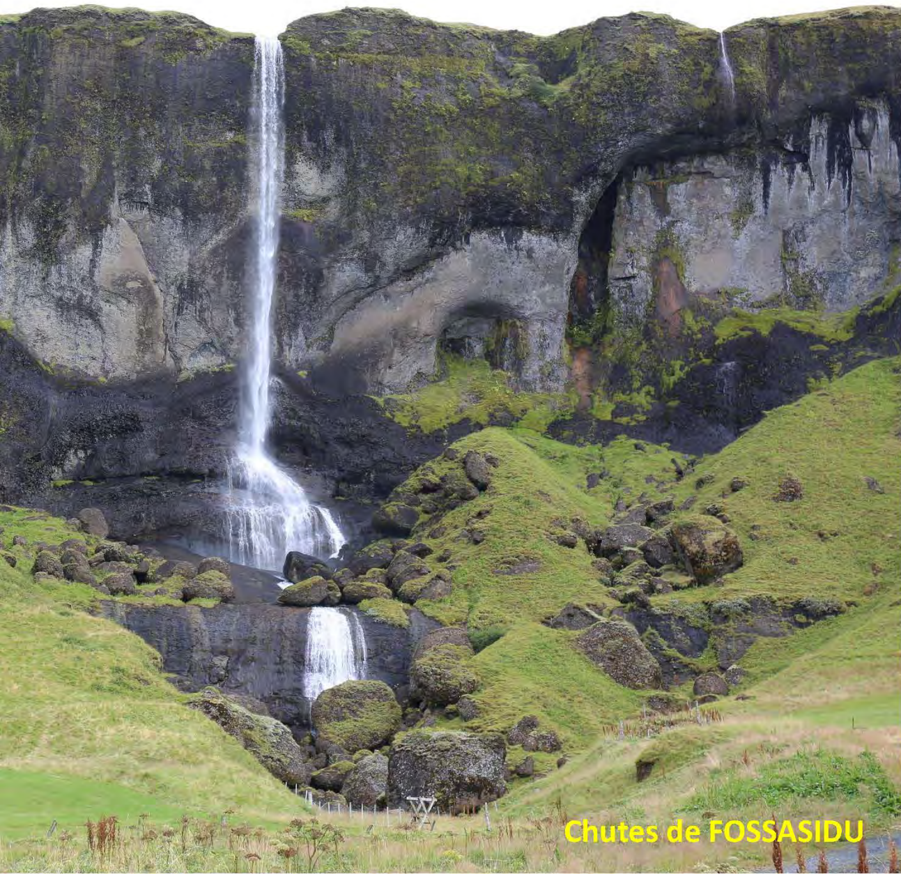
Chutes de FOSSASIDU