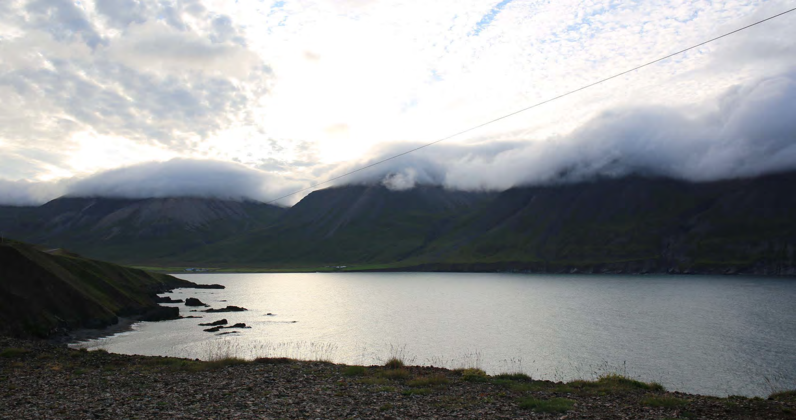
C'est ici que nous poserons le camp pour une première nuit en pleine nature islandaise