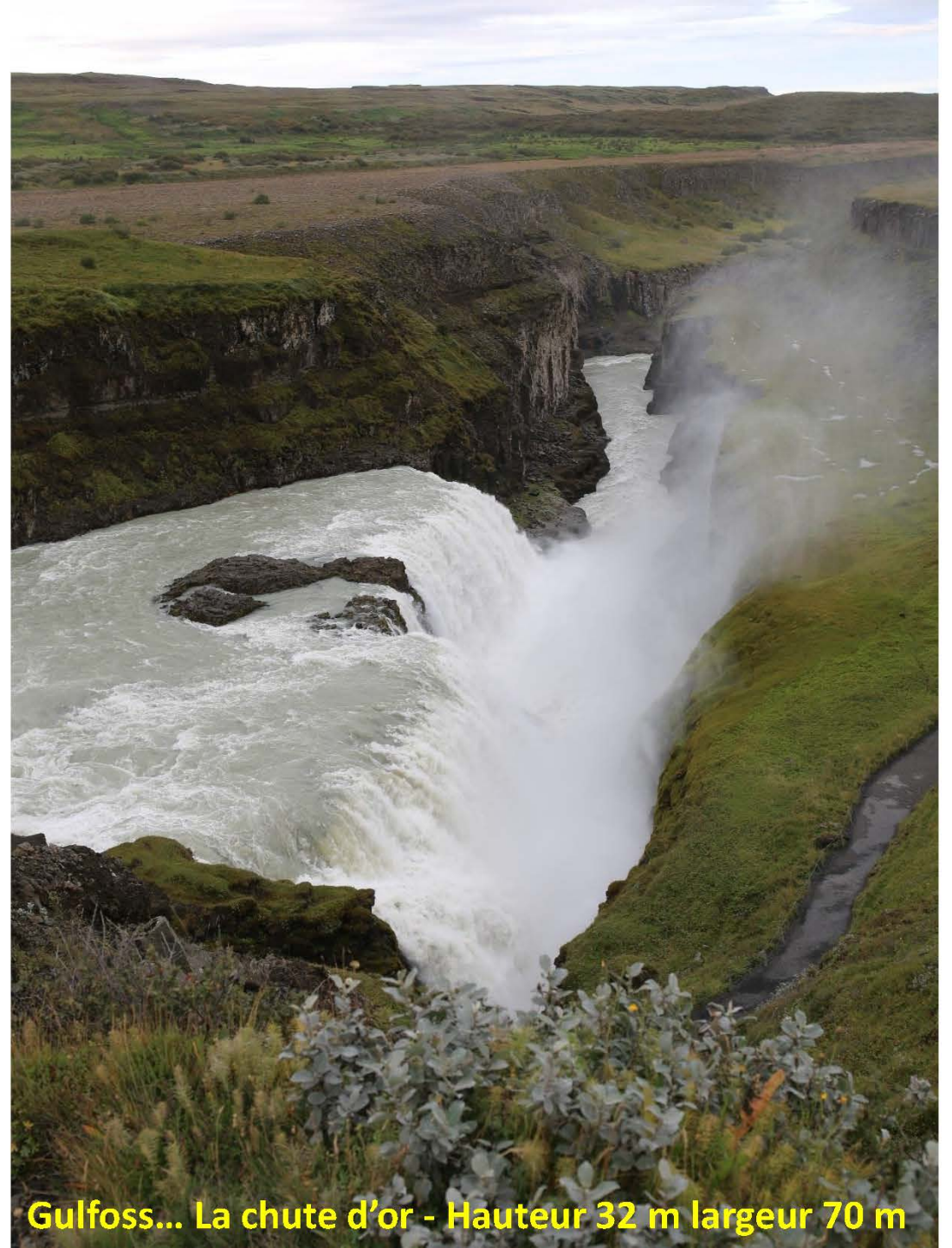
Gulfoss... La chute d'or - Hauteur 32 m largeur 70 m