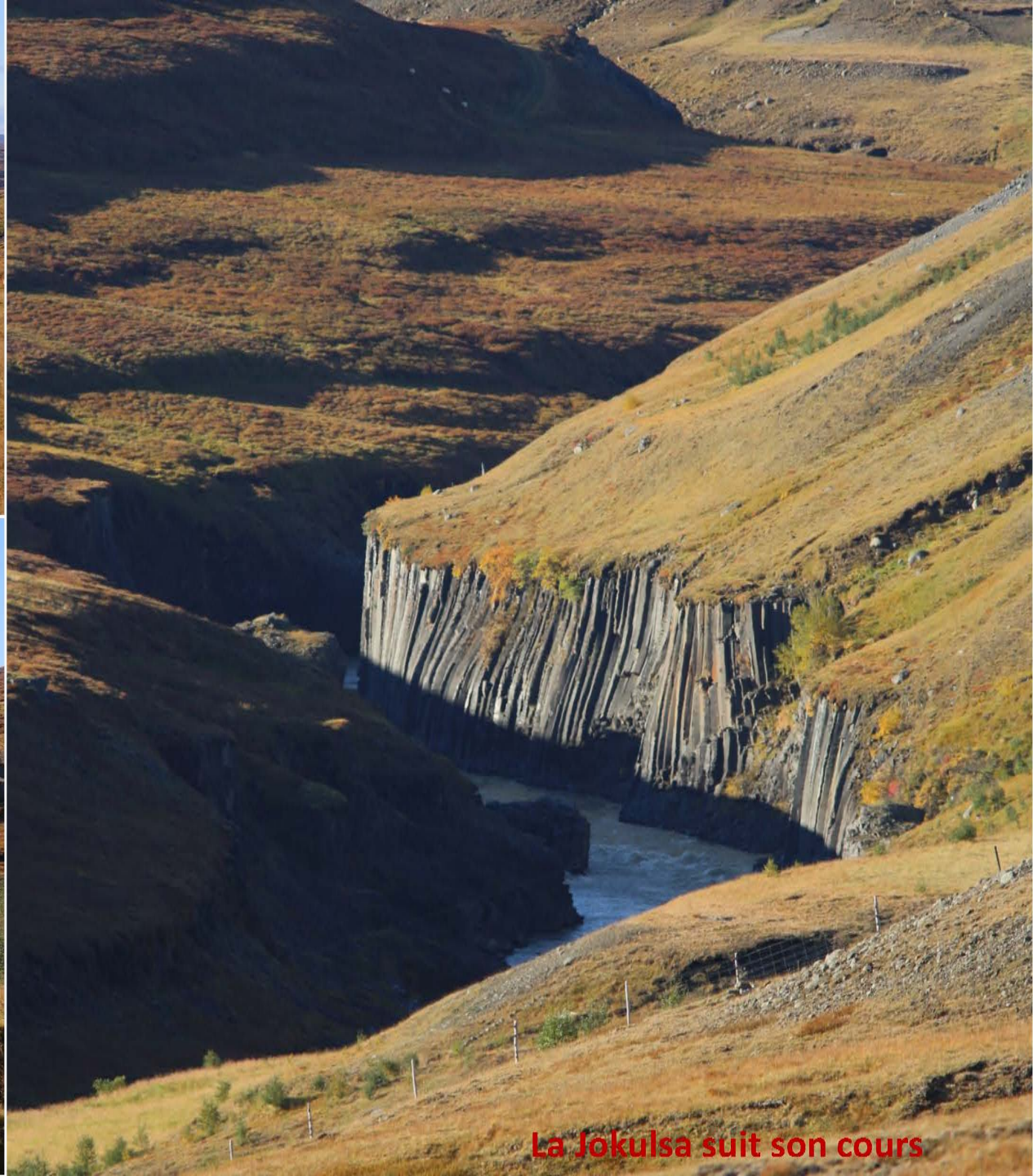
La Jokulsa suit son cours