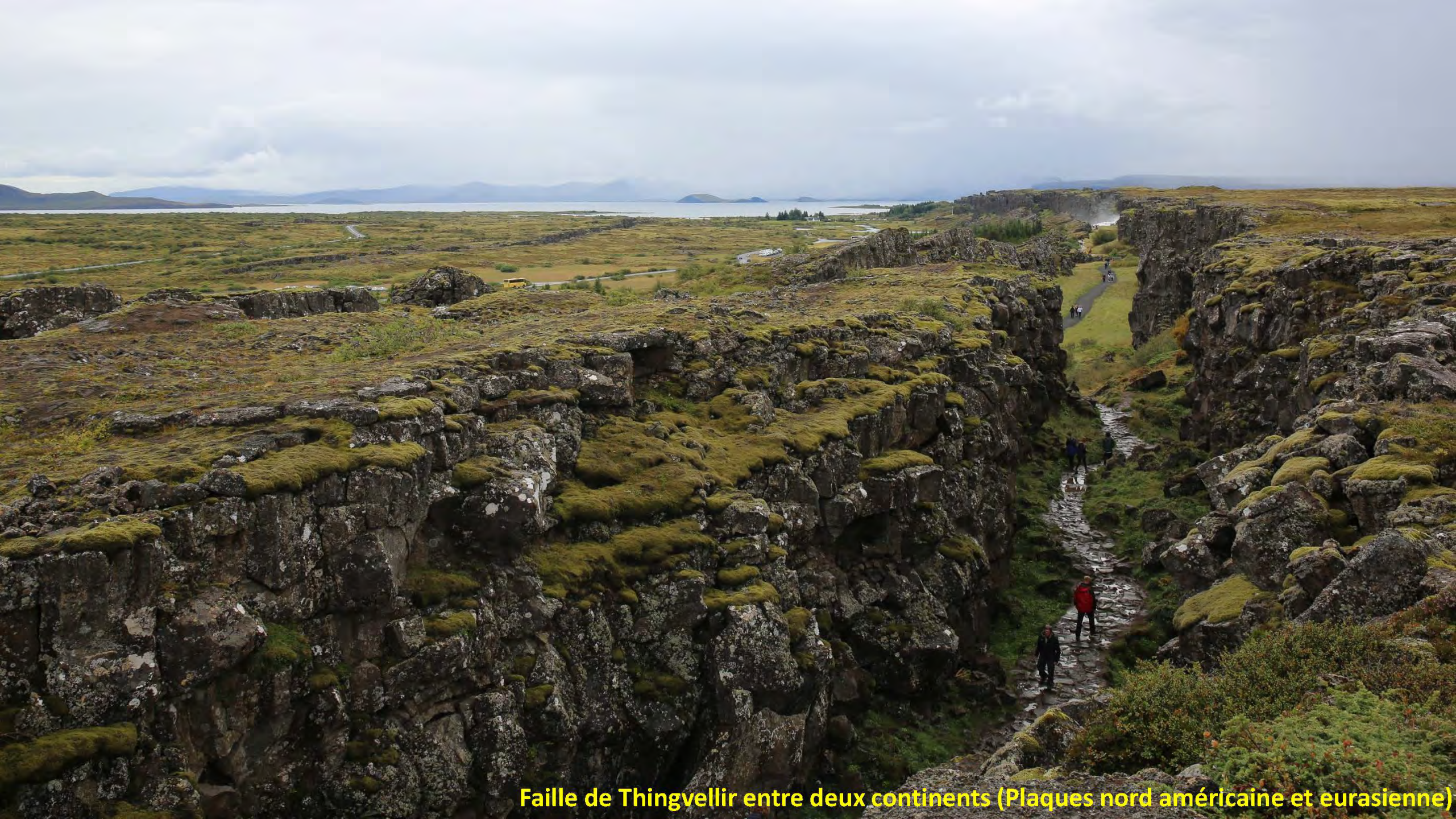
Faille de Thingvellir entre deux continents (Plaques nord américaine et eurasienne)