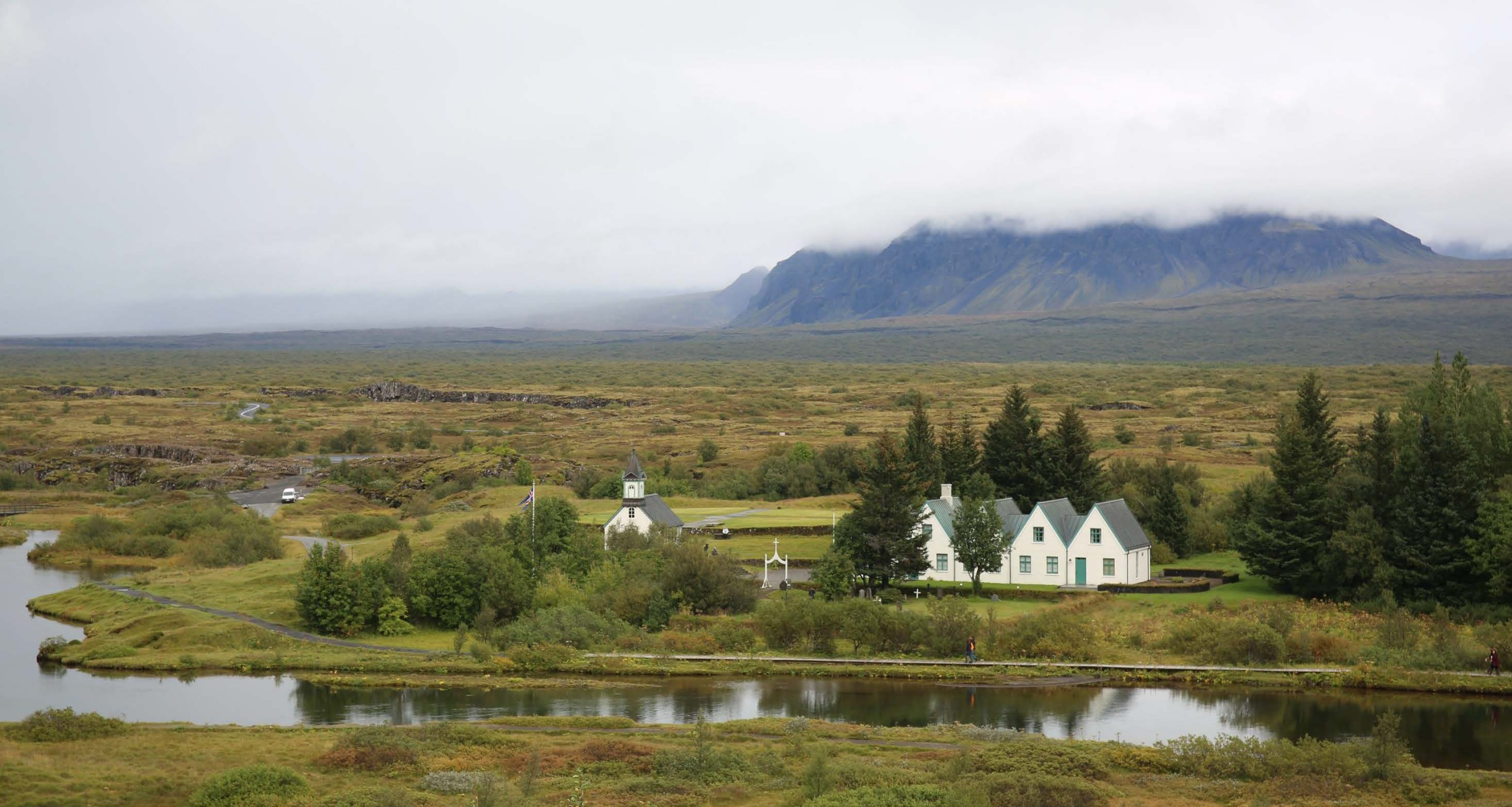
Lac de THINGVALLAVATN - Lac des plaines du parlement ( 10ème Siècle)