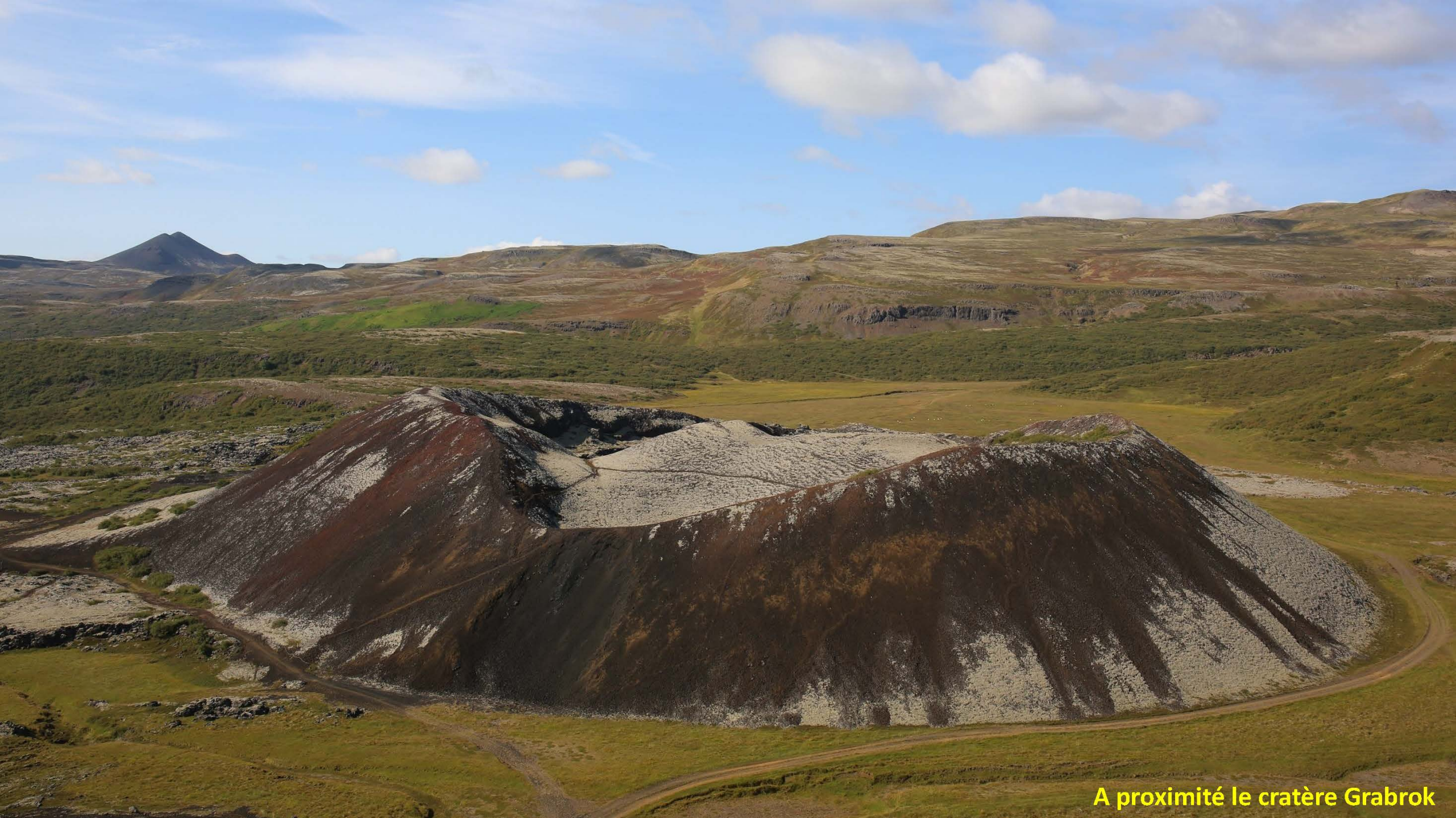
A proximité le cratère Grabrok