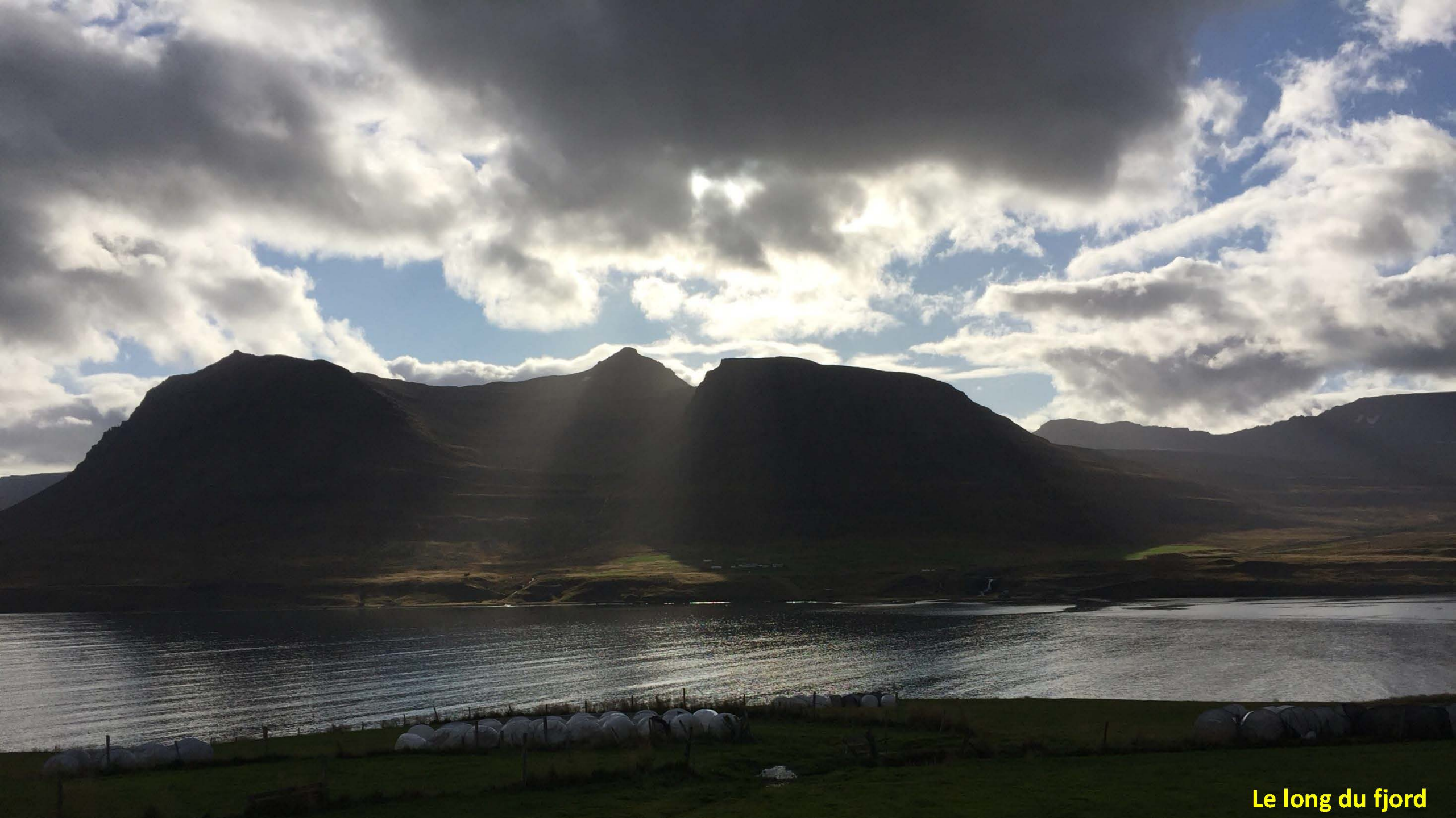
Le long du fjord