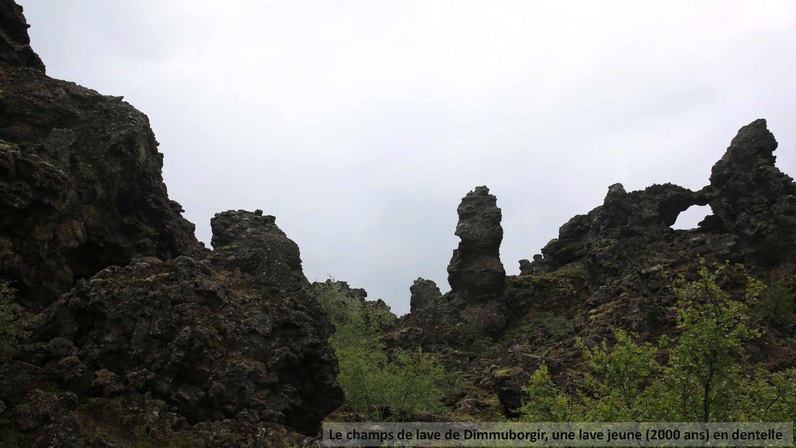
Le champs de lave de Dimmuborgir, une lave jeune (2000 ans) en dentelle