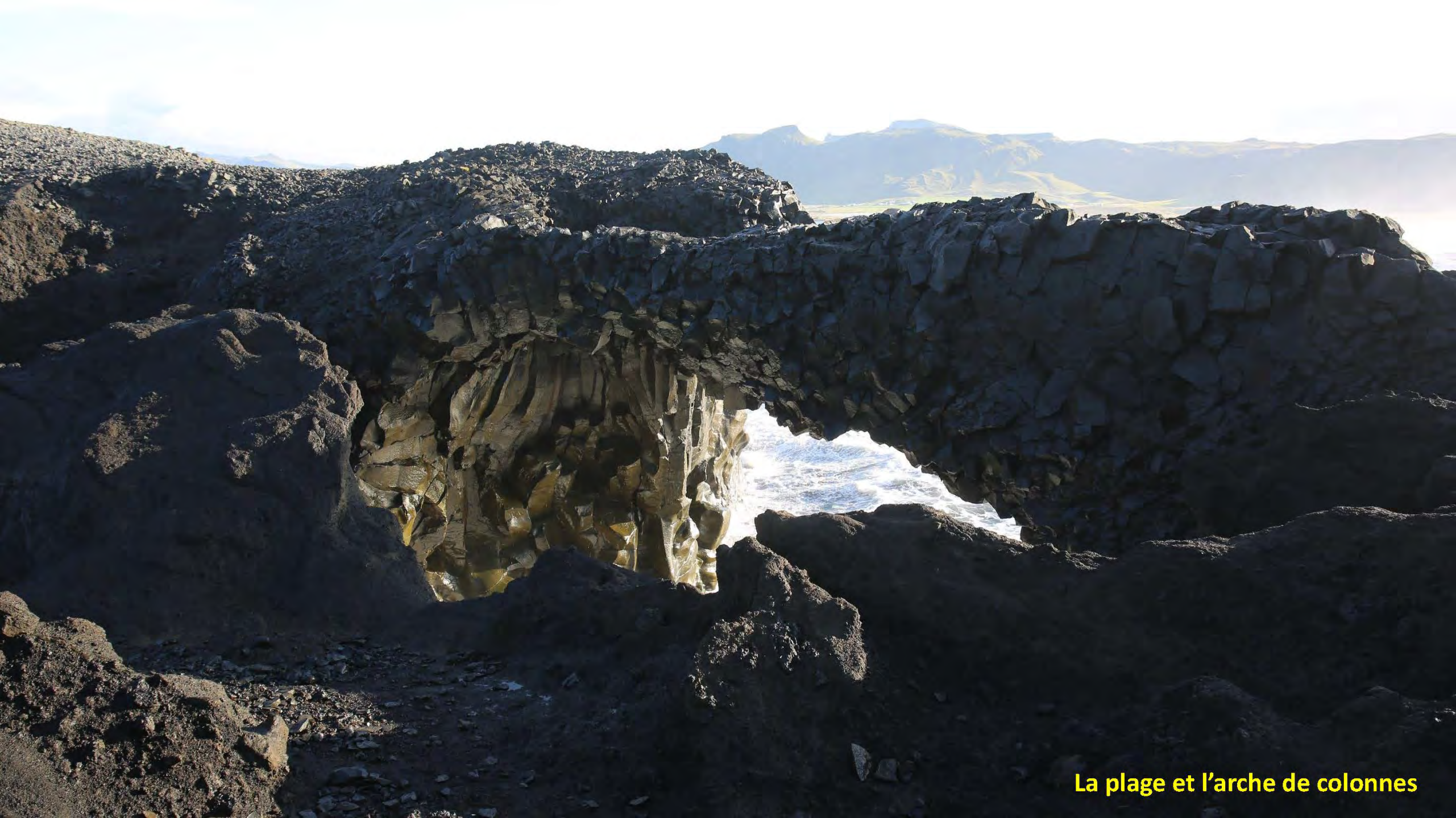
La plage et l'arche de colonnes