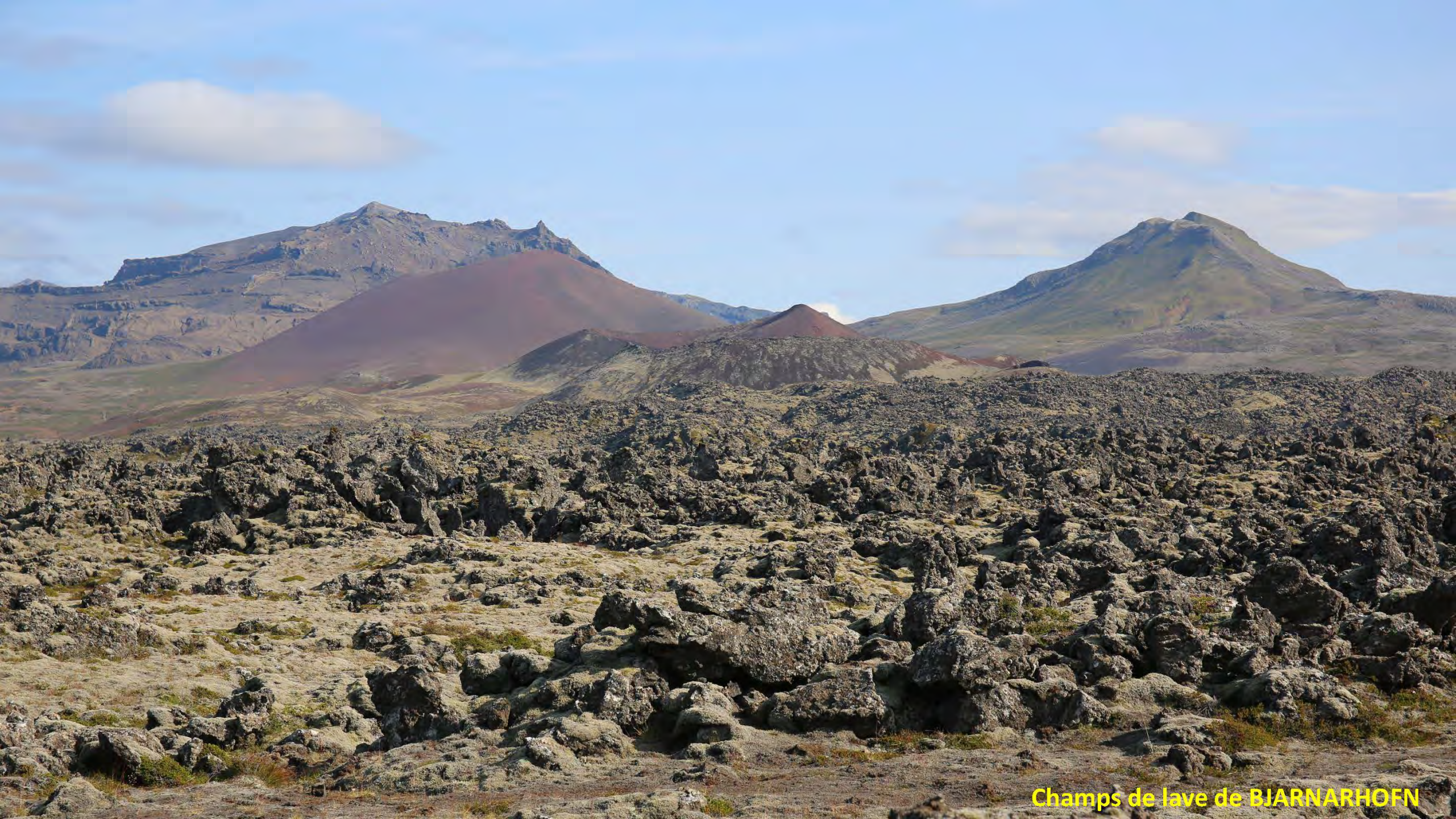
Champs de lave de BJARNARHOFN