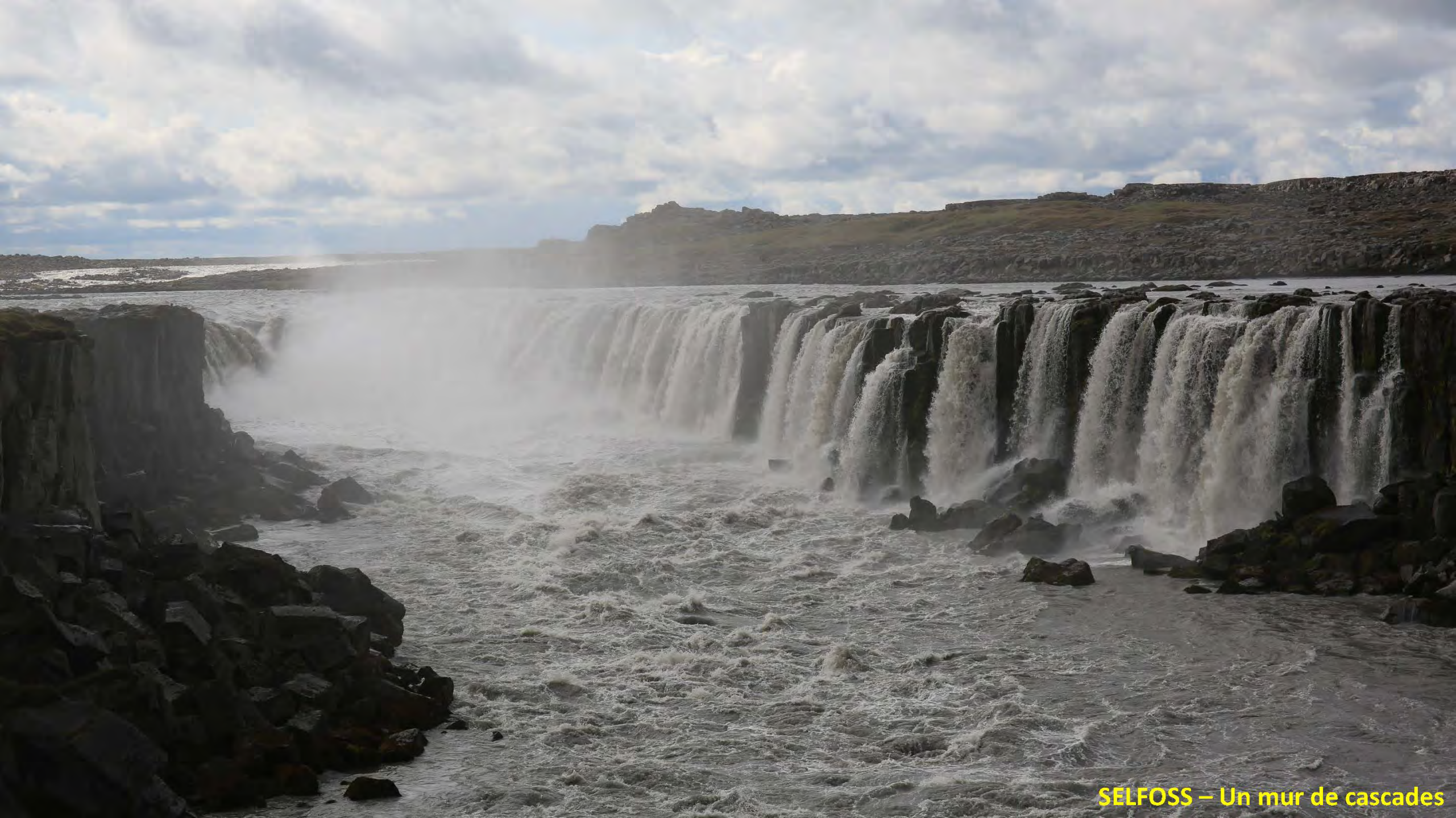
SELFOSS – Un mur de cascades