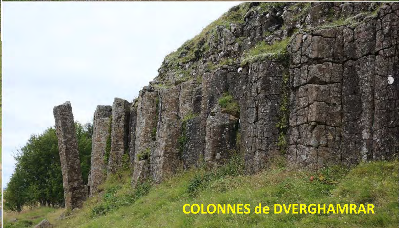
COLONNES de DVERGHAMRAR