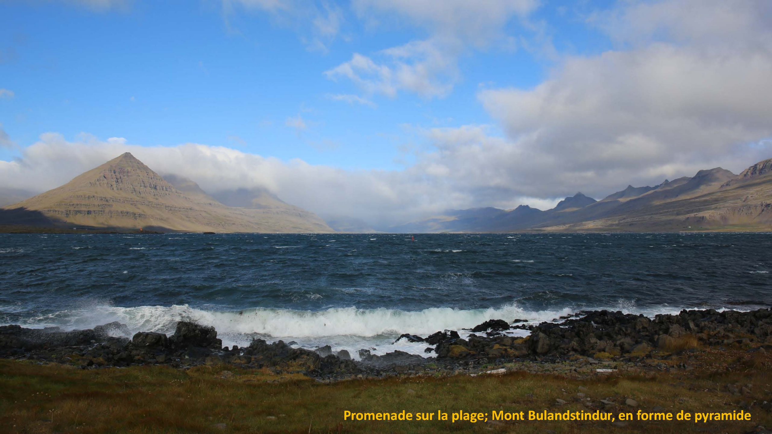
Promenade sur la plage; Mont Bulandstindur, en forme de pyramide