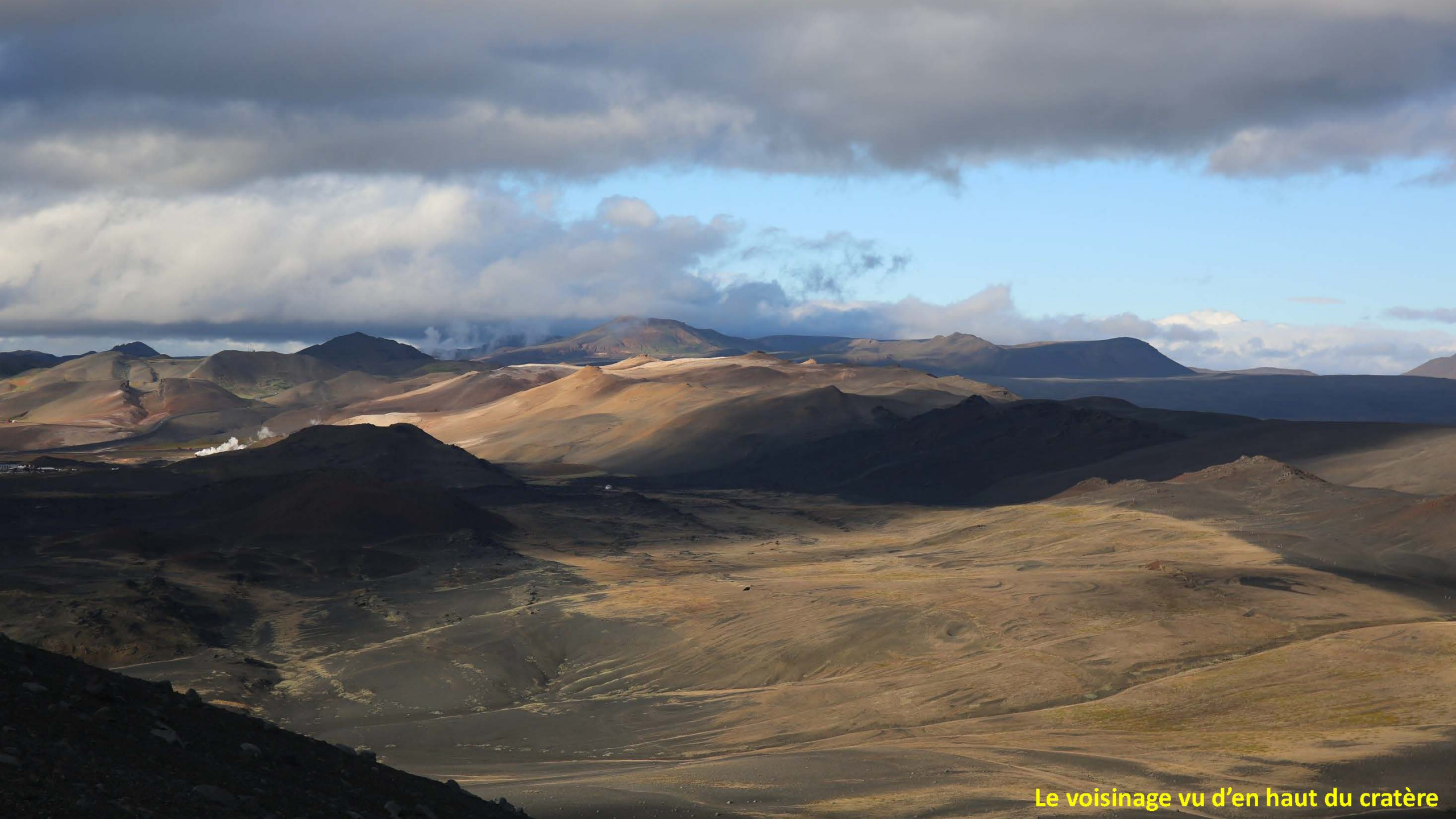
Le voisinage vu d'en haut du cratère