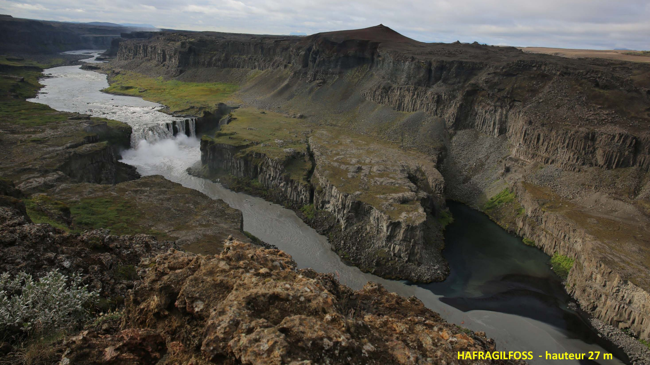
HAFRAGILFOSS - hauteur 27 m