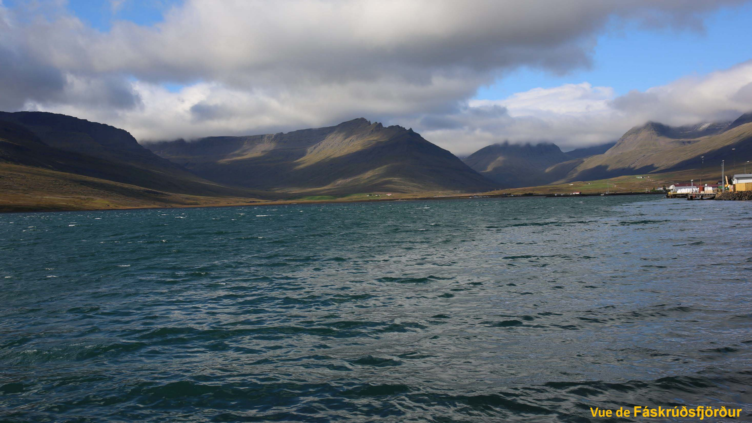
Vue de Fáskrúðsfjörður