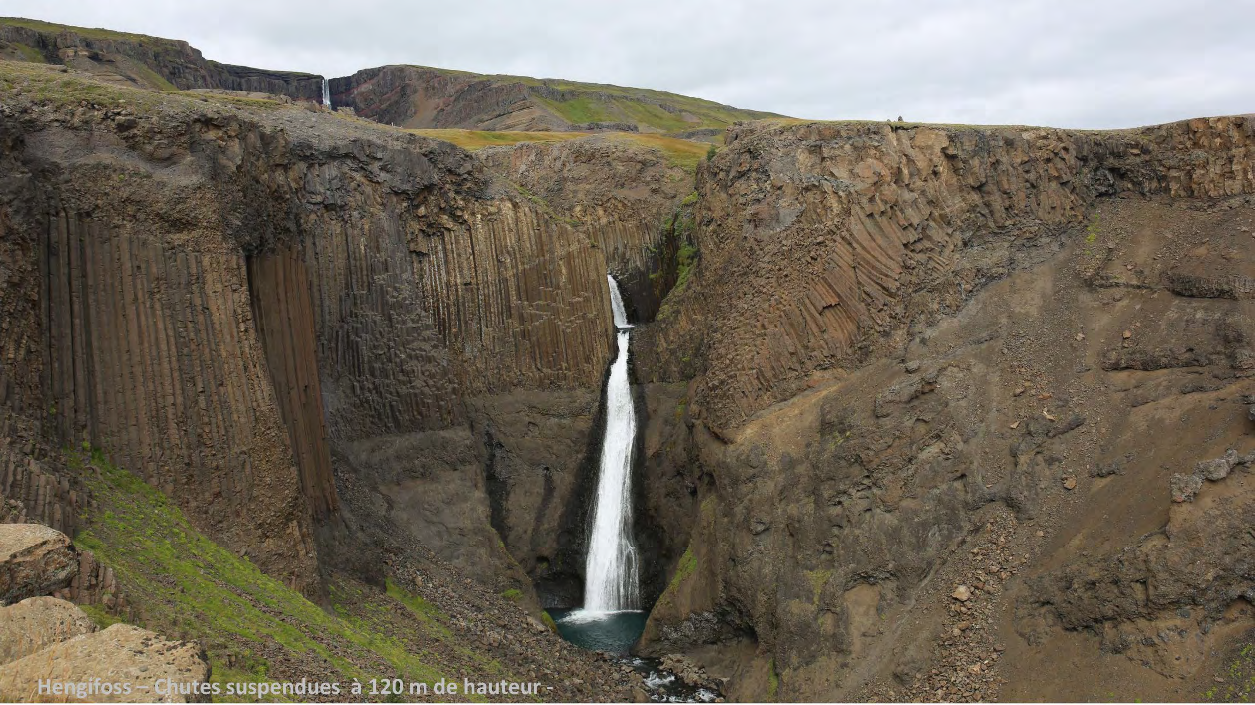
Hengifoss – Chutes suspendues à 120 m de hauteur -