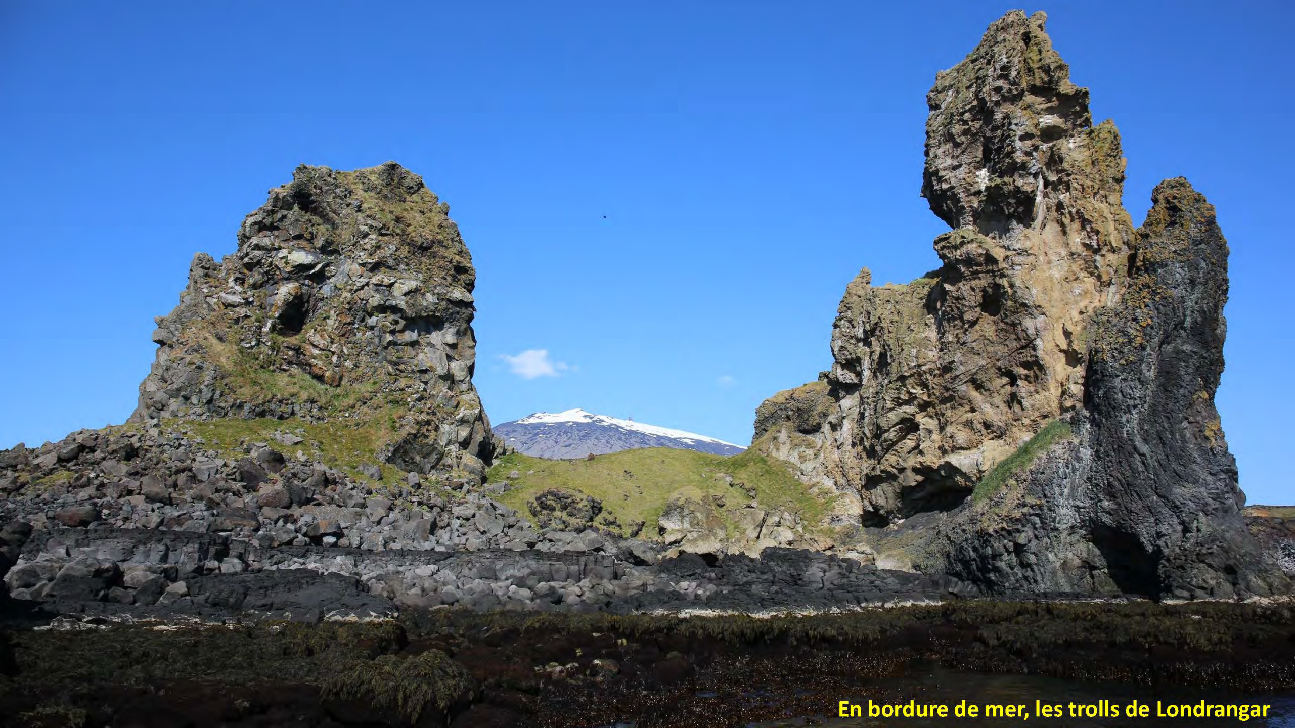
En bordure de mer, les trolls de Londrangar