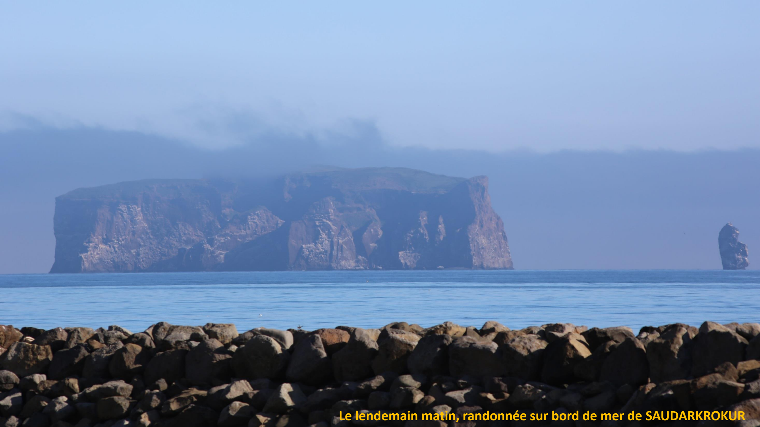
Le lendemain matin, randonnée sur bord de mer de SAUDARKROKUR