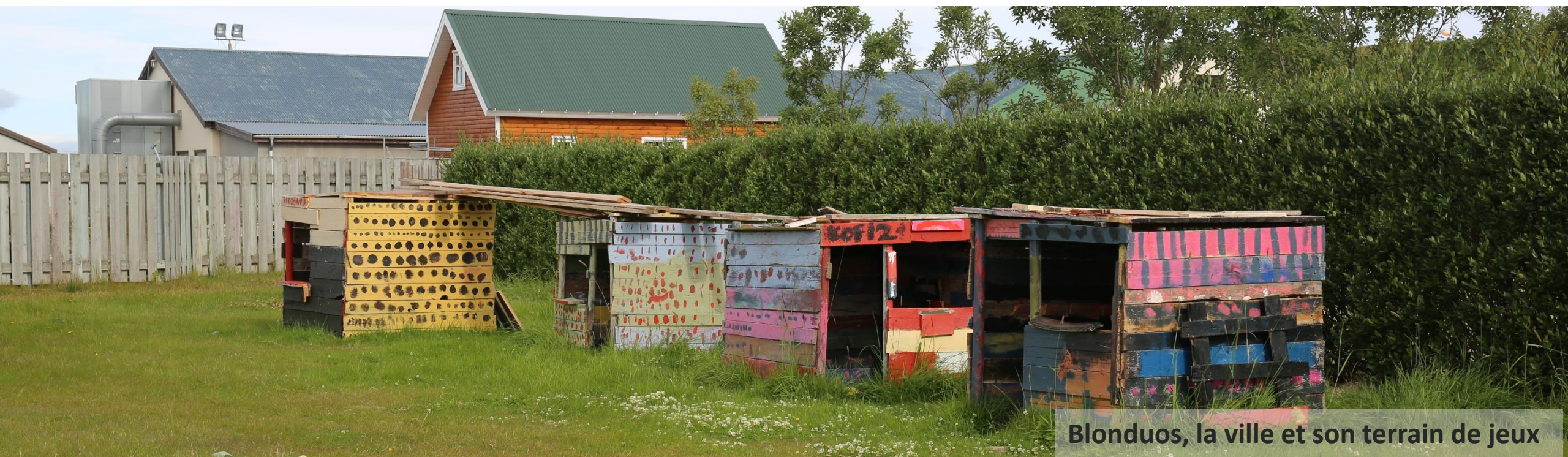
Blonduos, la ville et son terrain de jeux