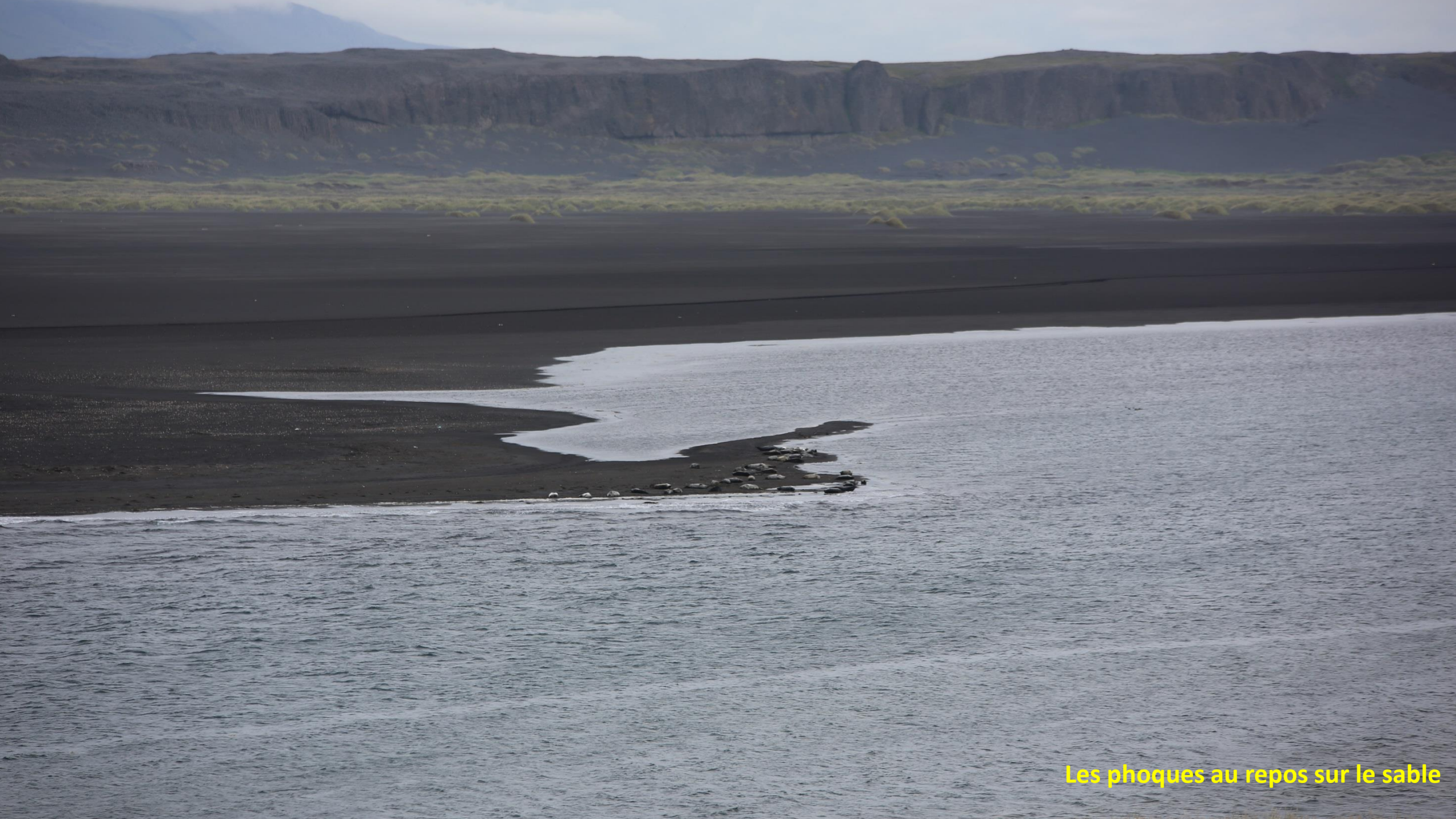
Les phoques au repos sur le sable