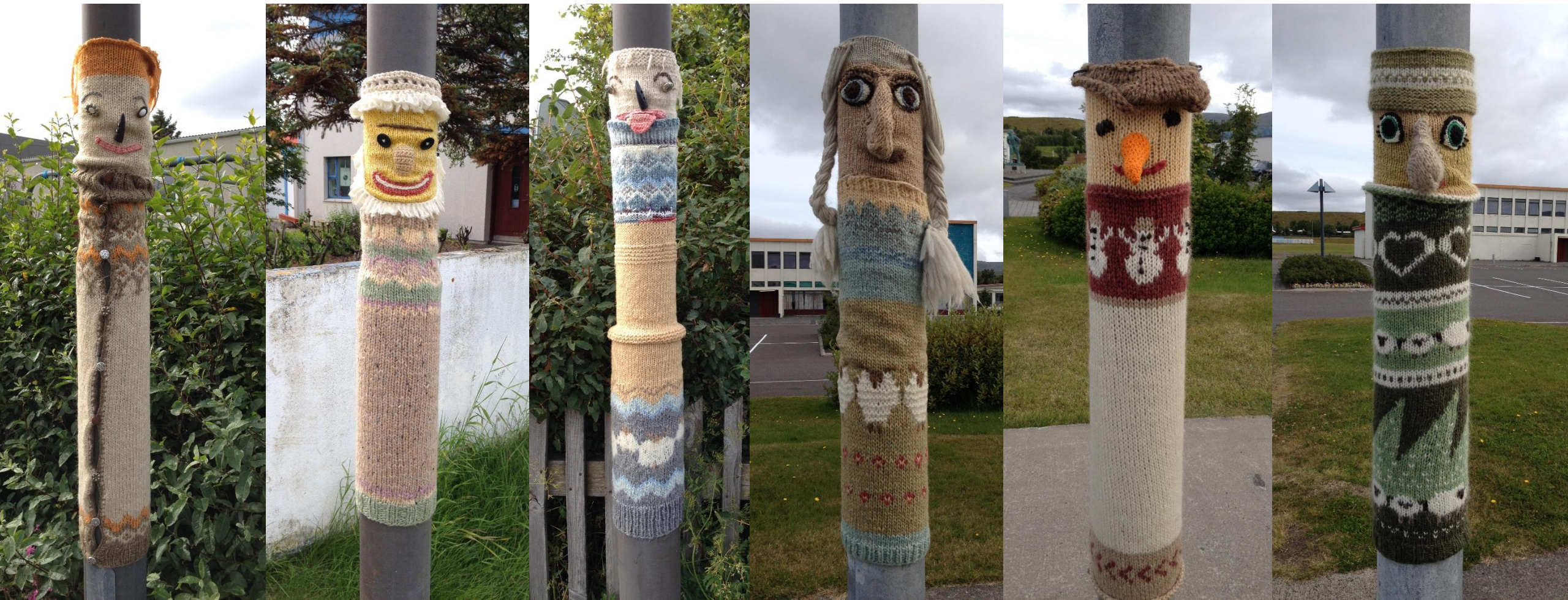
Une signalétique qui interpelle, ces trolls tricotés nous conduisent vers le musée