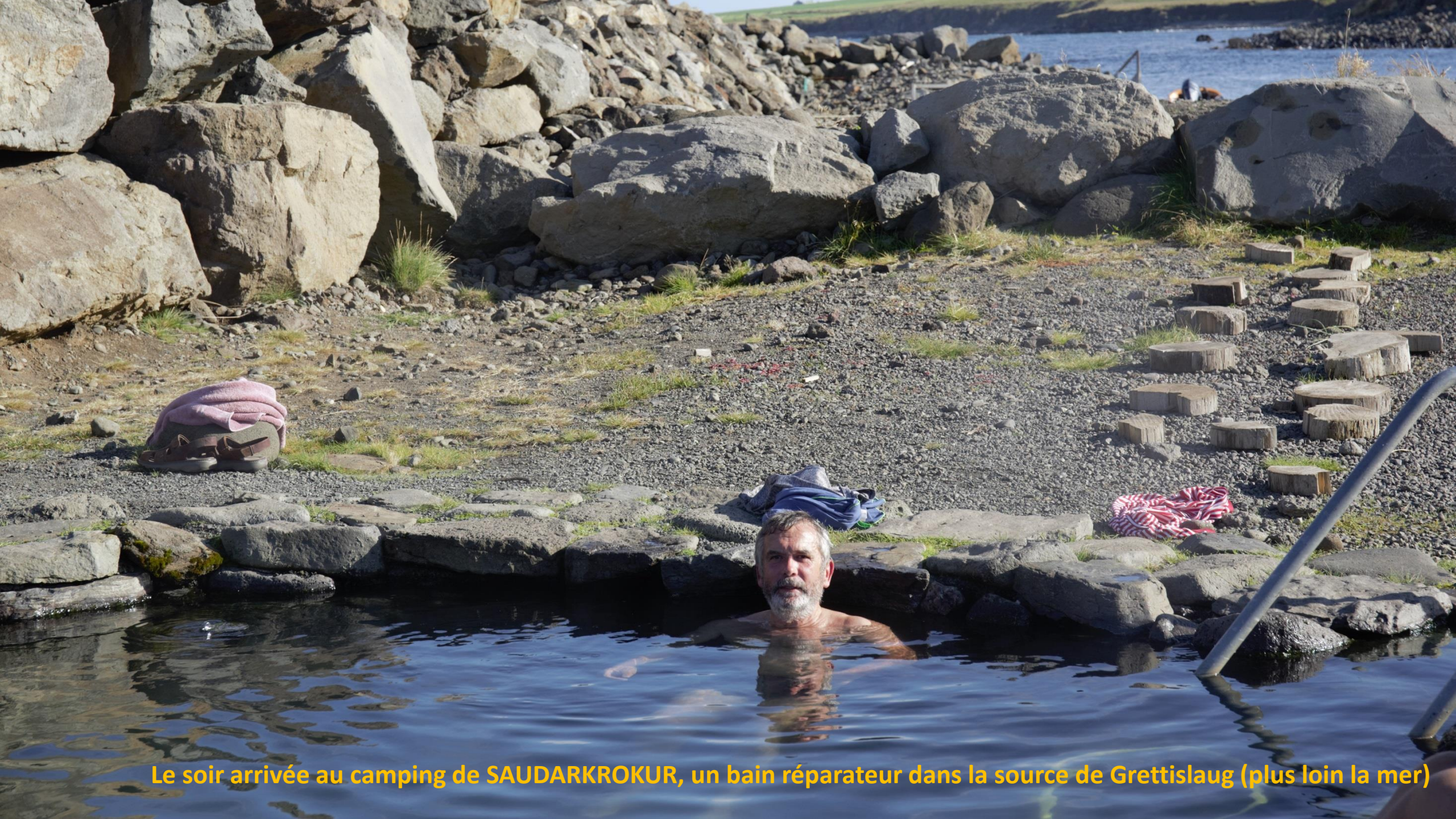
Le soir arrivée au camping de SAUDARKROKUR, un bain réparateur dans la source de Grettislaug (plus loin la mer)