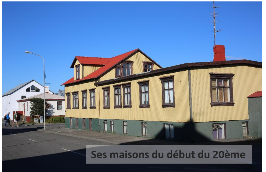
Ses maisons du début du 20ème