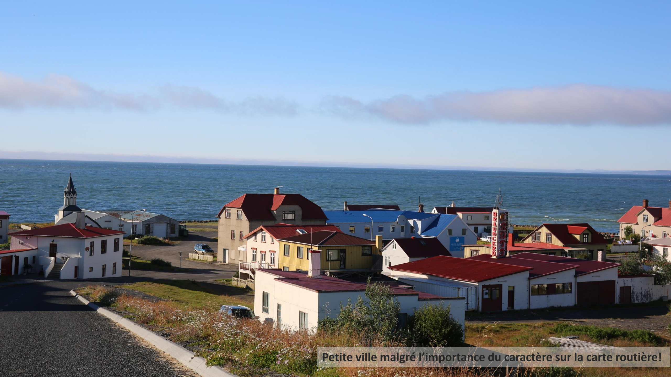
Petite ville malgré l'importance du caractère sur la carte routière!