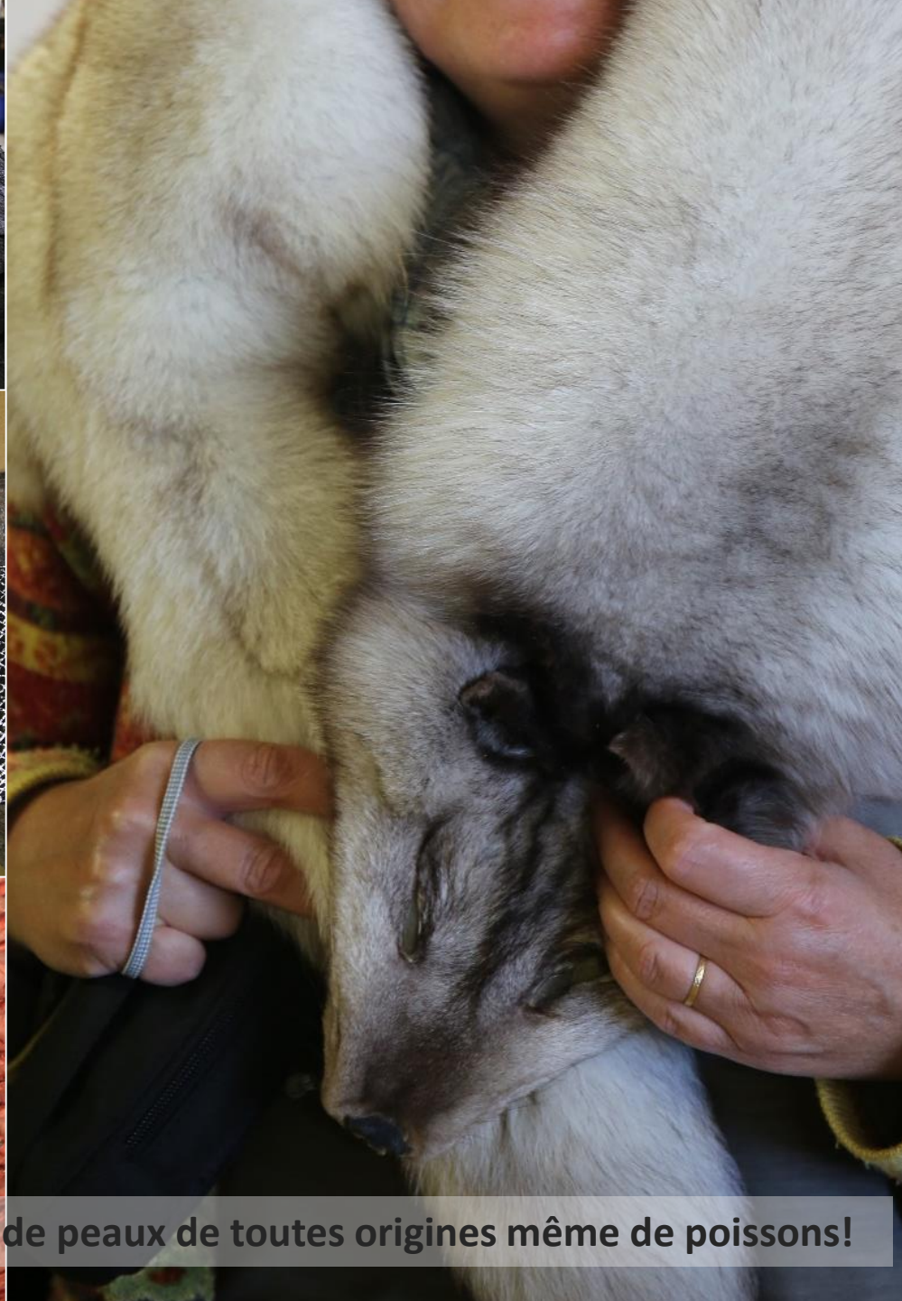
Visite de la tannerie de SAUDARKROKUR, tannerie de peaux de toutes origines même de poissons!