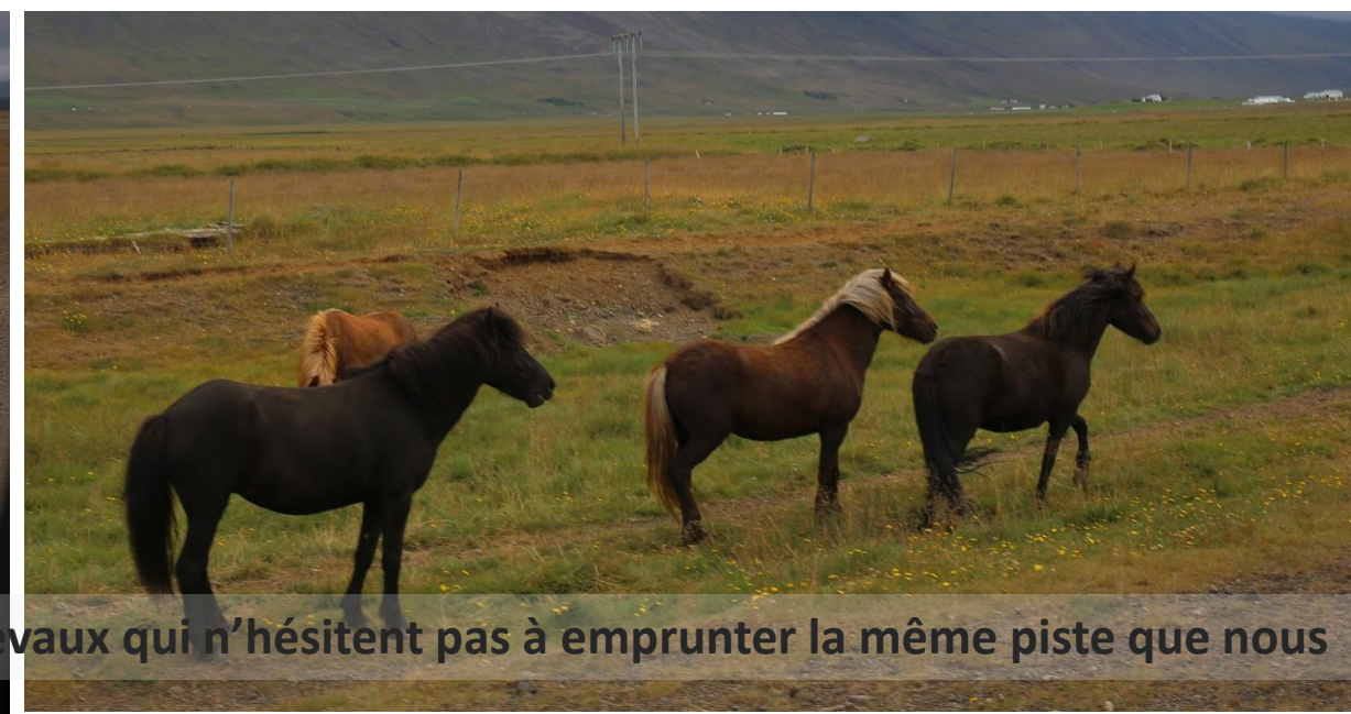
C'est reparti. Sur la route, des chevaux qui n'hésitent pas à emprunter la même piste que nous