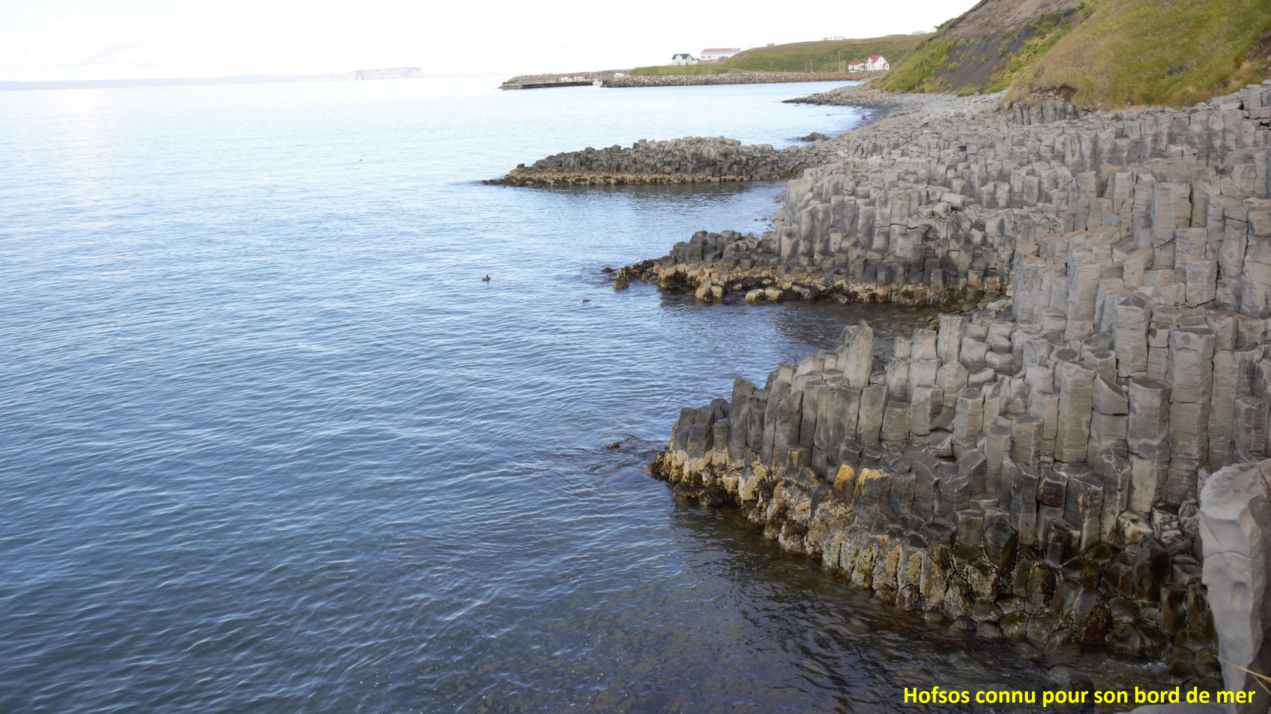
Hofoss connu pour son bord de mer