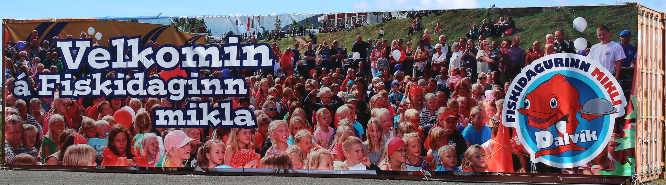
Bienvenue pour la fête Fiskidaginn, la fête du poisson