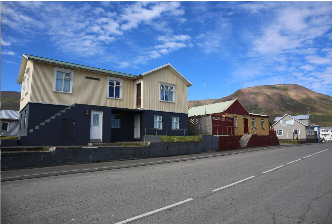
Quelques maisons typiques de Dalvik