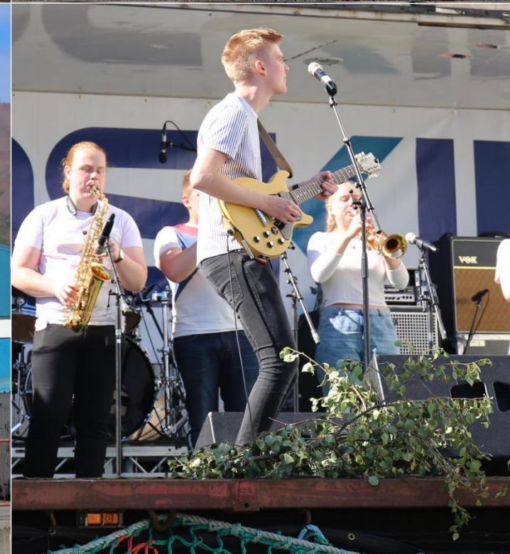
Les routes sont « barrées pour atteindre le port, un podium et des musiciens sont là pour animer...