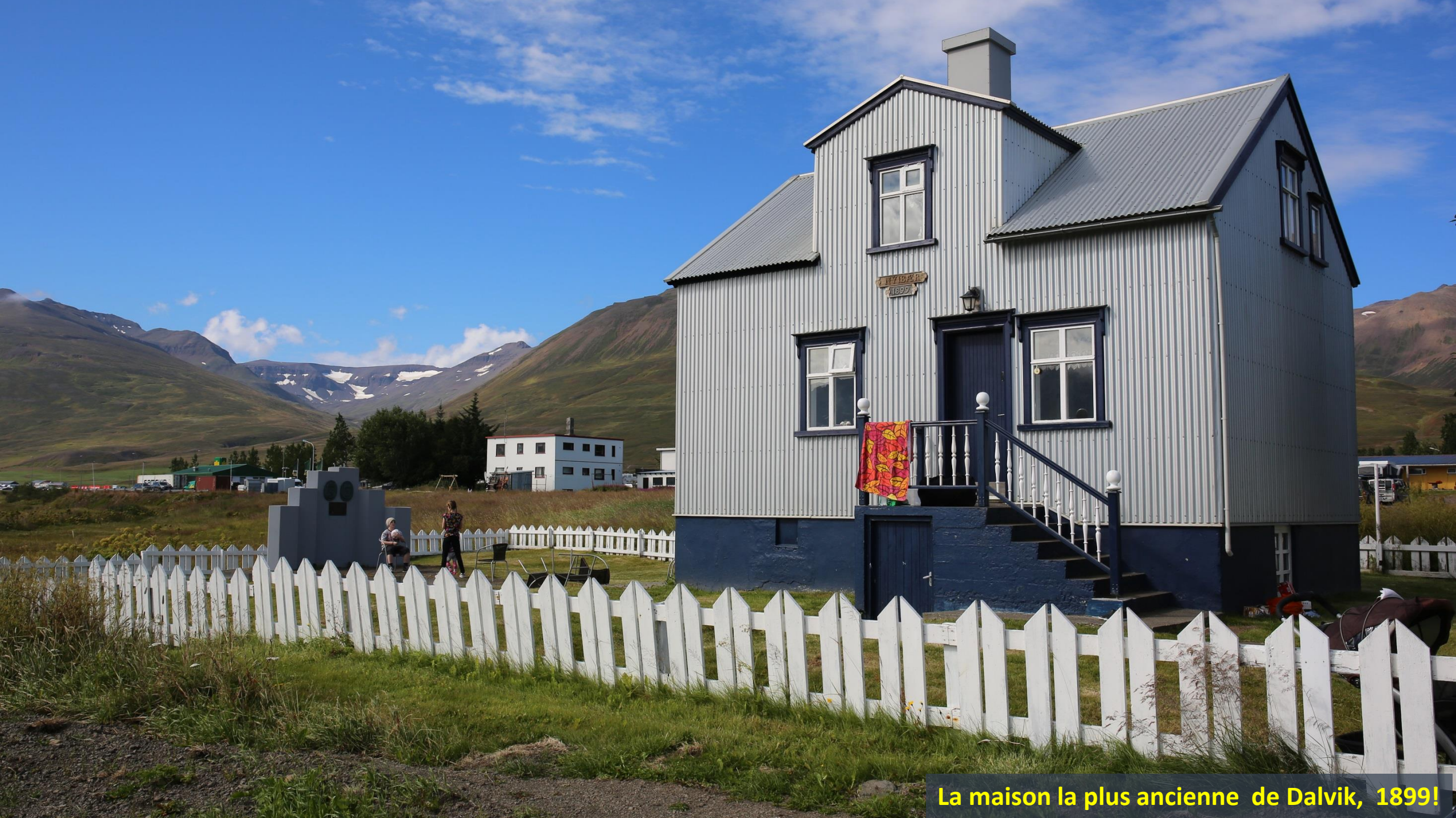
La maison la plus ancienne de Dalvik, 1899!