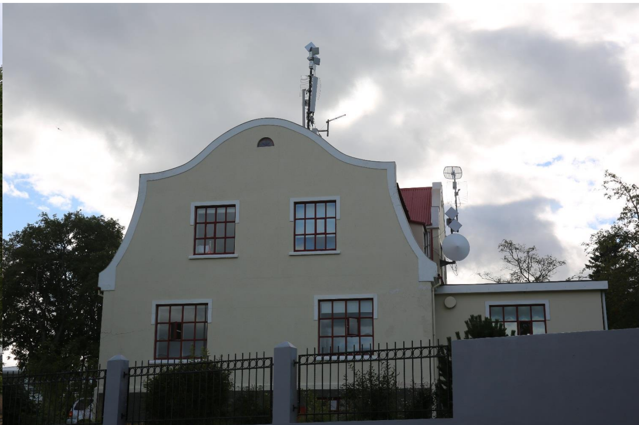
Quelques maisons hors du centre avant de regagner le camping pour la nuit