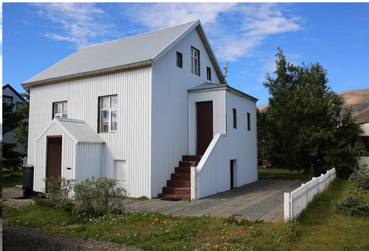
Quelques maisons typiques de Dalvik