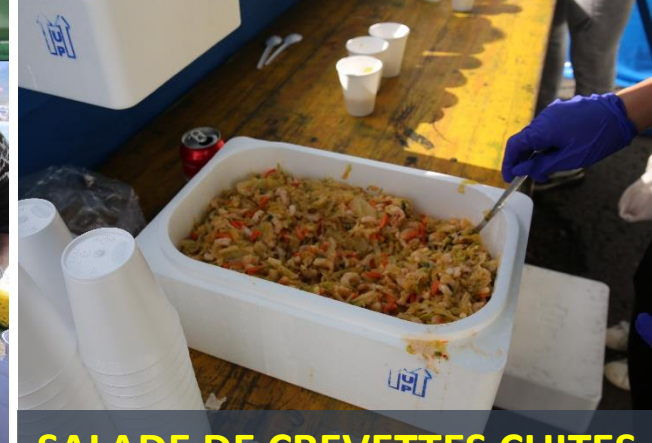
SALADE DE CREVETTES CUITES