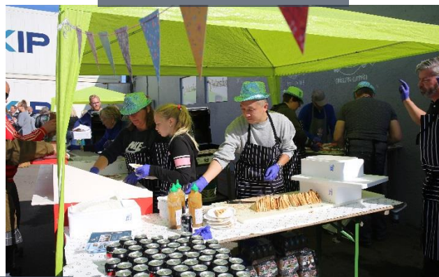
EAU OU COCA