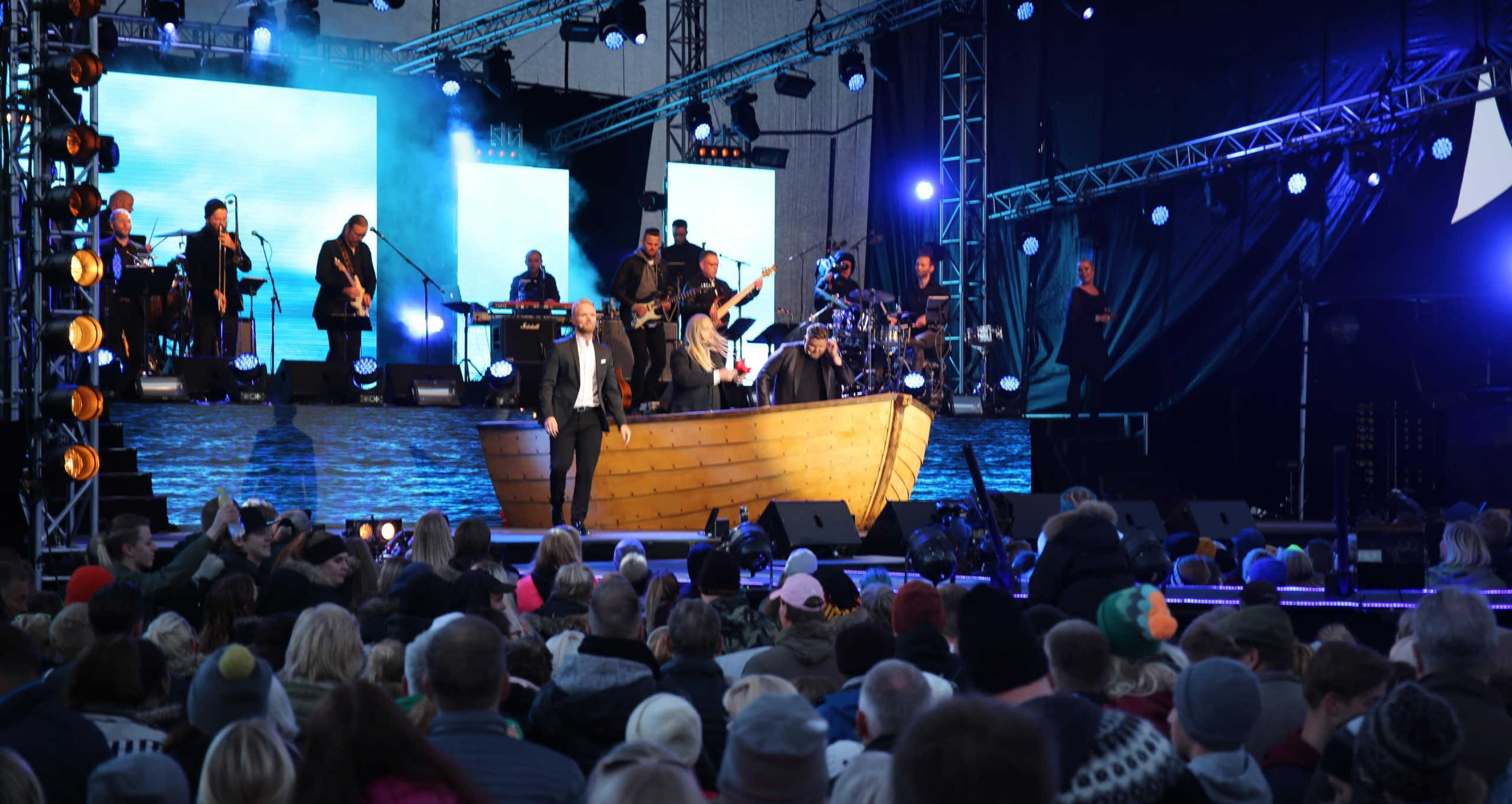
Le spectacle débutant vers 21h devant près de 2000 spectateurs en majorité des touristes islandais et étrangers