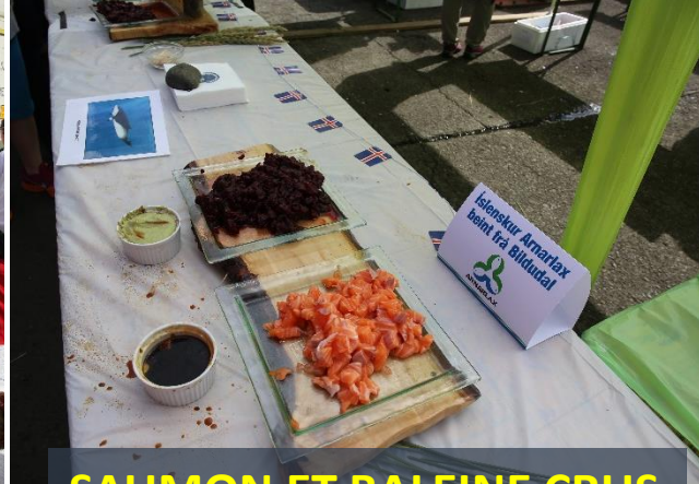
SAUMON ET BALEINE CRUS