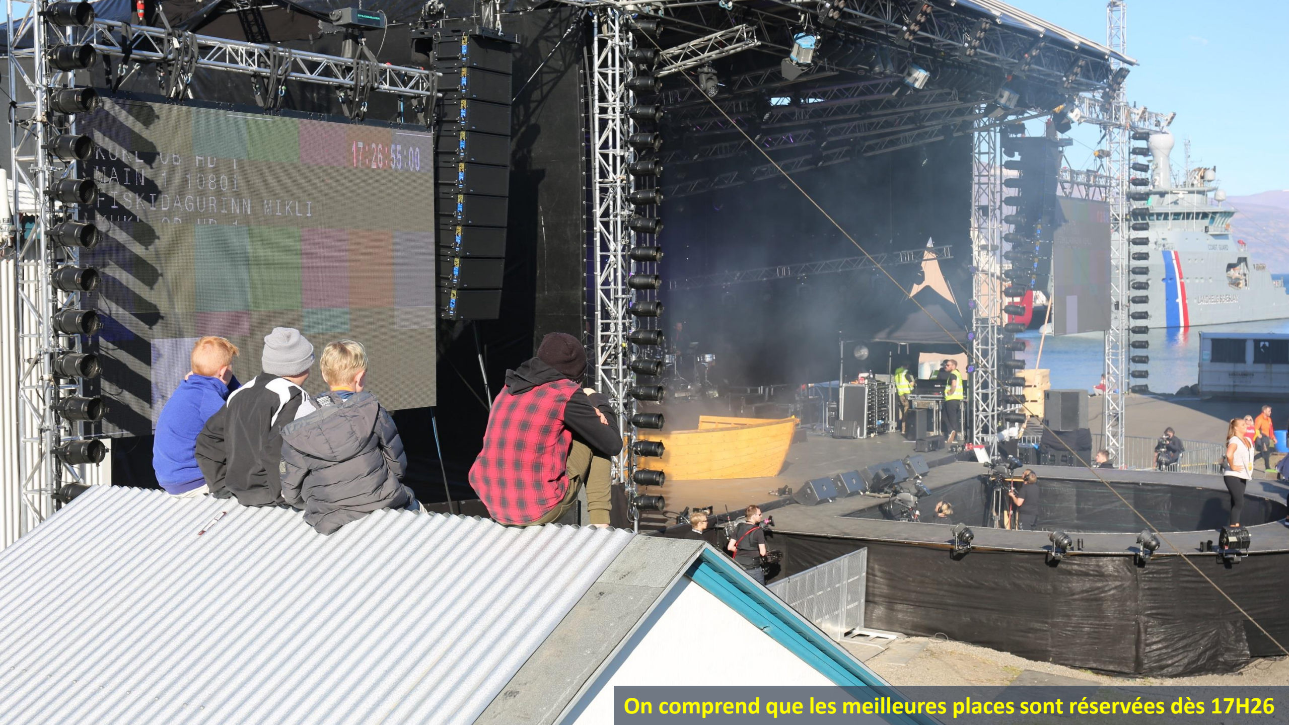
On comprend que les meilleures places sont réservées dès 17H26