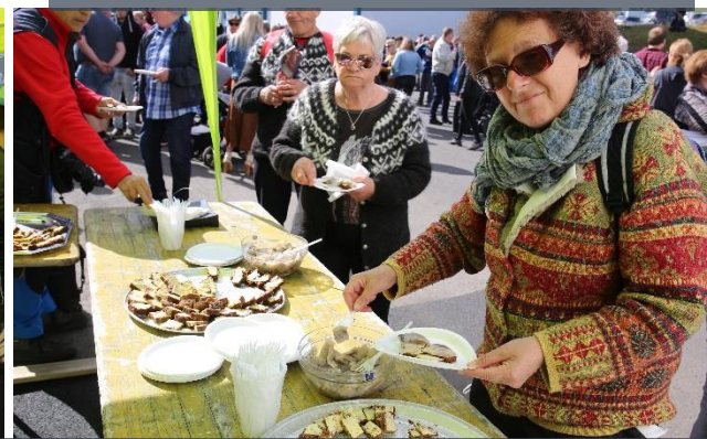
HARENGS MARINES SUR RUGBRAUD