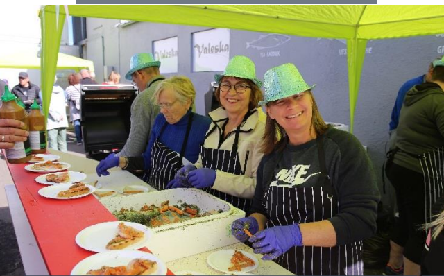
TOAST DE SAUMON FUME