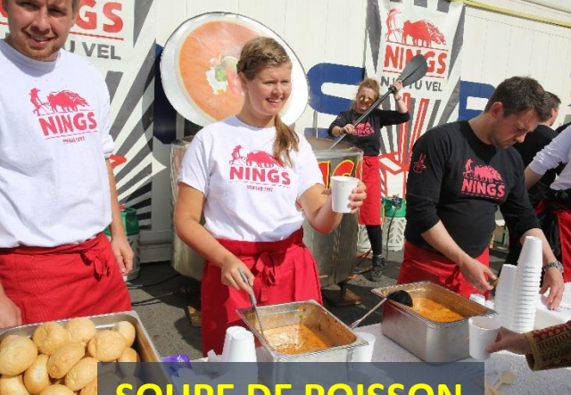
SOUPE DE POISSON