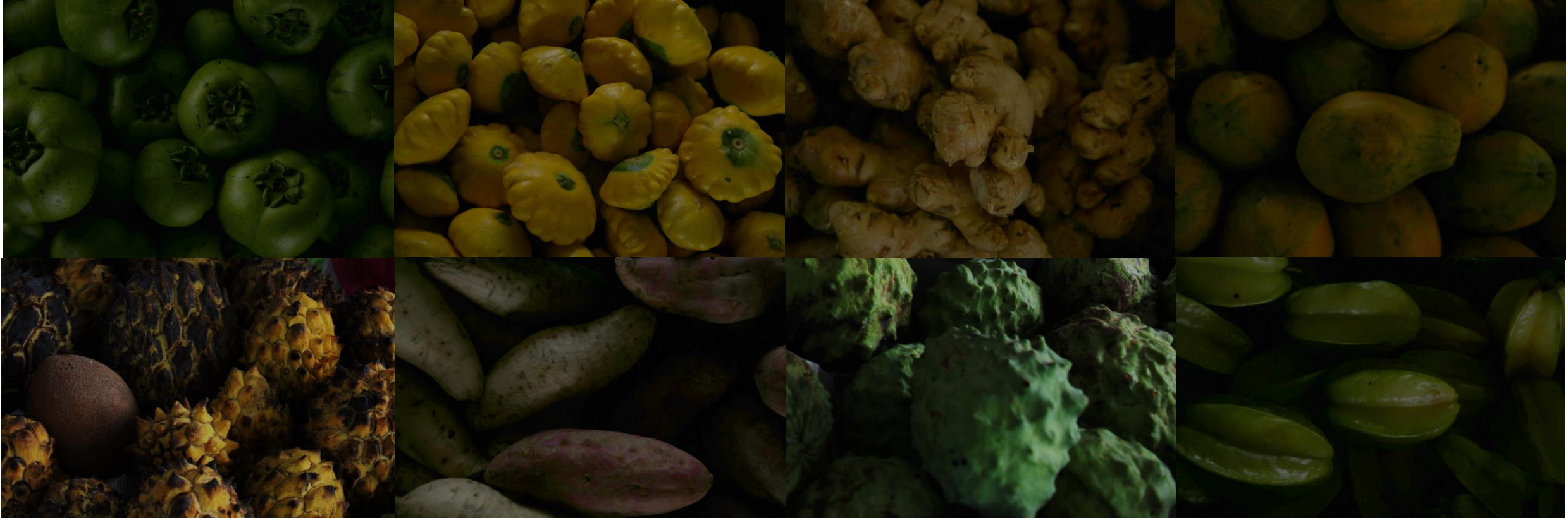
Carambola – Papaye - Black sapote - Button Squash – Patate - Green custard apples – Rollinia amazonian custard apples - Gingembre