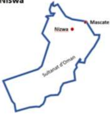
Fort de Jabrin