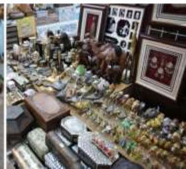
Le souk, pour apprécier les senteurs de l'encens de Salah, les galeries élaborées, avec leurs venelles propices à découvrir ça et là l'article souvenir.