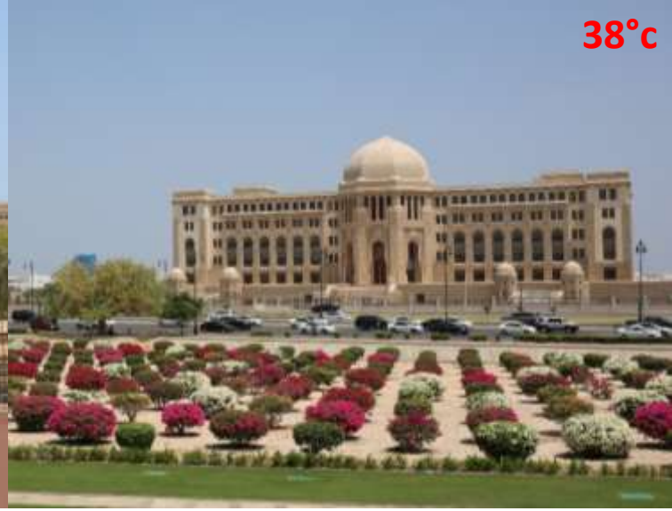
Le palais du Sultan dans le vieux Muscat, les jardins fleuris