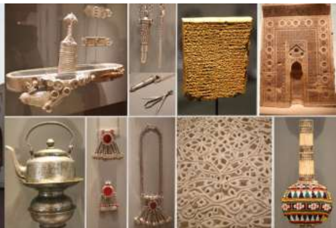
Le musée national, flambant neuf, présentant des vidéos, écrans interactifs, des vestiges ... permettant de comprendre l'évolution du pays ... L'opéra, les forts Portugais, la corniche...